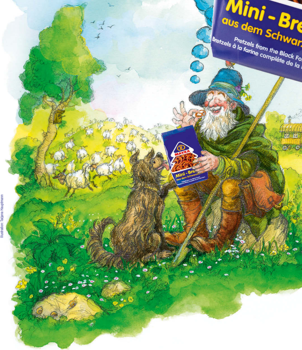
Illustration: Tatjana Hauptmann