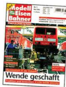
Titel: Optische Vermessung des Lokkastens von 114 016 am 3. November 2005.