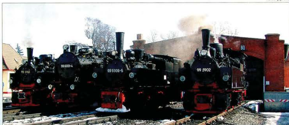
Lokparade in Gernode am 4. März 2006: 99 5901, 99 6001, 99 5906 und 99 5902 (v. li.).