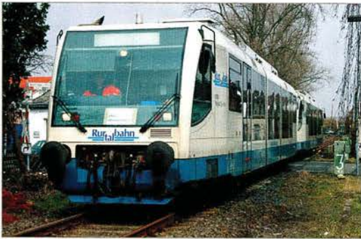
Die Regiosprinter 6.010 und 6.015 mit VIA 84665 nach Wiebelsbach-Heubach am 1. März 2006 bei Großauheim.

● Der geringe Fahrzeugbestand, 22 Itino-Tw, der „Fahrzeugmanagement Region Frankfurt RheinMain GmbH“ (Fahma) macht sich seit Beginn des Betreiberwechsels auf der Odenwaldbahn (MEB berichtete) bemerkbar. Besonders in den Berufs- und Hauptverkehrszeiten reichen die Platzkapazitäten, die durch die Betreibergesellschaft VIAS angeboten werden, nicht aus. Außerplanmäßige Fahrzeugausfälle bei den Itinos von Bombardier führten Ende Februar dazu, dass durch die Rurtalbahn GmbH (Mitgesellschafter der VIAS) zwei Regiosprinter in einem Umlauf zwischen Hanau und Wiebelsbach-Heubach eingesetzt werden mussten, um den Verkehr aufrechterhalten zu können. Damit ist auch die durch VIAS angekündigte Kapazitätserhöhung in den Verkehrsspitzen durch veränderte Umlaufgestaltung, verbunden mit Doppel- beziehungsweise Dreifachtraktion, vorerst hinfällig.