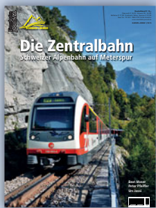
Die Zentralbahn Schweizer Alpenbahn auf Meterspur Best.-Nr. 731501