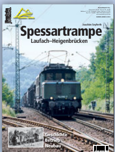
Spessarttrampe Laufach-Heigenbrücken Best.-Nr. 731602

Jeweils 100 Seiten im Großformat 22,5 x 30,0 cm, Klebebindung, ca. 160 Abbildungen, € 15,-