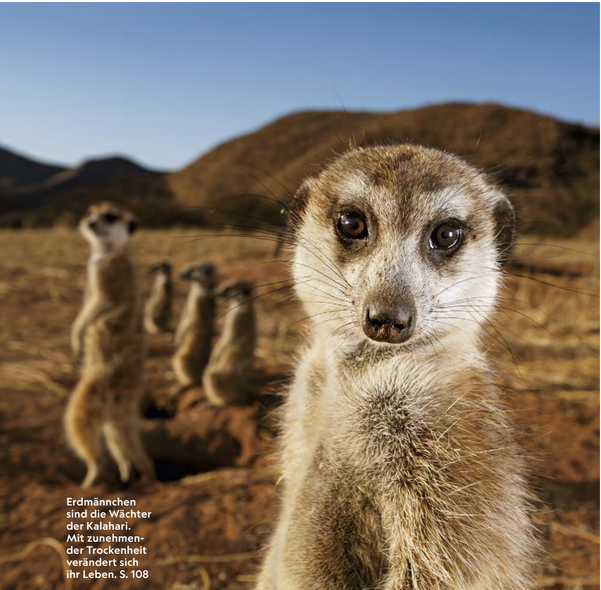
Erdmännchen sind die Wächter der Kalahari. Mit zunehmender Trockenheit verändert sich ihr Leben. S. 108