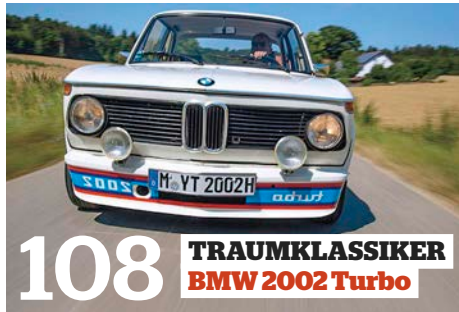
108 TRAUMKLASSIKER BMW 2002 Turbo