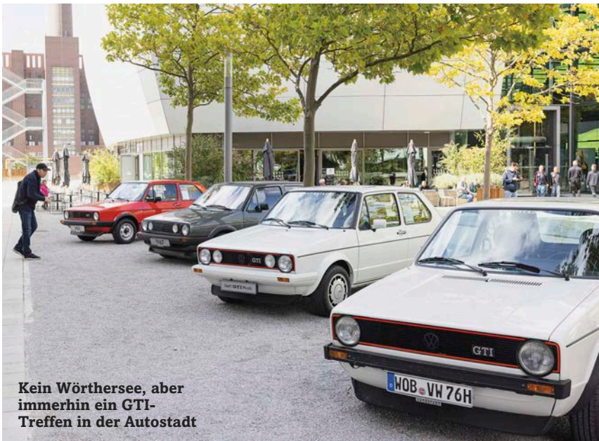
Kein Wörthersee, aber immerhin ein GTI-Treffen in der Autostadt