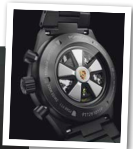
Ein 911er plus eine Porsche-Design-Uhr werden in New York versteigert

Im Dezember 2022 sollten Porsche-Sammler und -Liebhaber einen Trip nach New York ins Auge fassen. Anlässlich des 50-jährigen Markenjubiläums von Porsche Design versteigert das Auktionshaus Sotheby's zwei einzigartige Ikonen: einen restaurierten Porsche 911 S 2.4 Targa von 1972 zusammen mit einem Timepiece-Unikat auf Basis des legendären Porsche Design Chronographen I aus