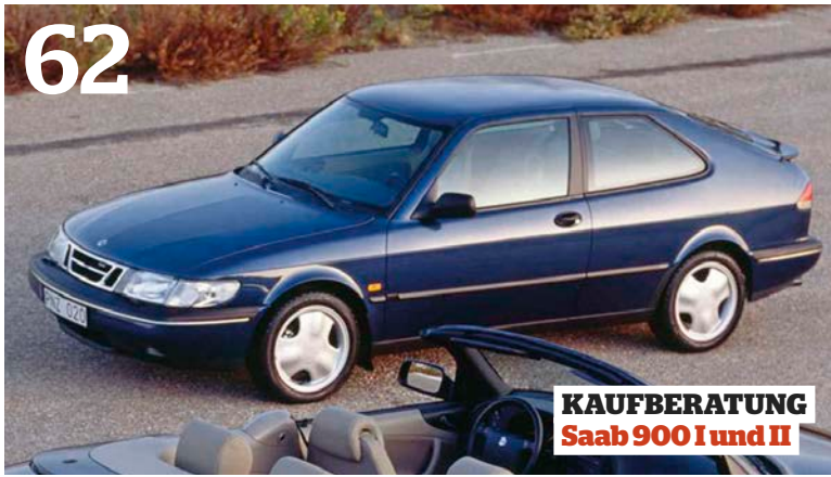
KAUFBERATUNG Saab 900 I und II