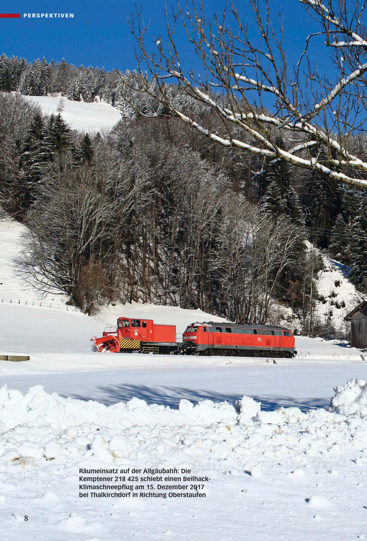
Räumeinsatz auf der Allgäubahn: Die Kemptener 218 425 schiebt einen Beilhack-Klimaschneepflug am 15. Dezember 2017 bei Thalkirchdorf in Richtung Oberstaufen