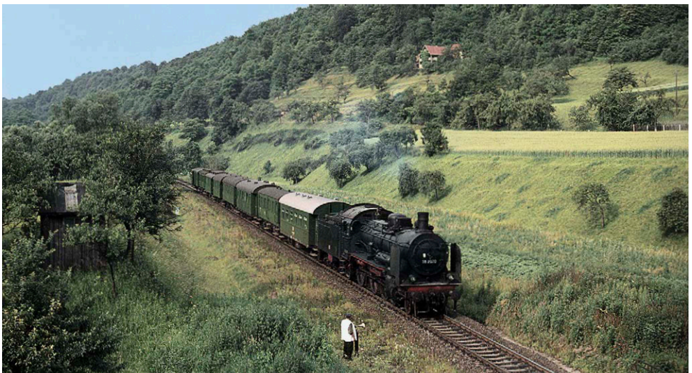
Einen bunt zusammengewürfelten Personenzug hat 38 2070 am 27. Juni 1968 zwischen Zeutsch und Orlamünde am Haken. Das Jahr 1972 erlebte die Lok nicht mehr