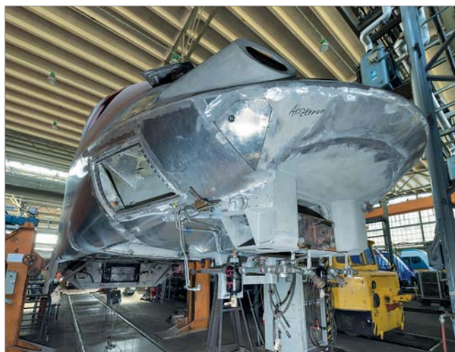
Aluminium-Leichtbau war in den frühen 1970er-Jahren beim ET 403 angesagt.