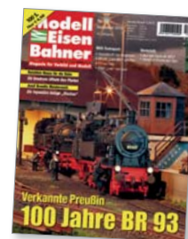
Titel: Modelle von Roco

Knapp sechs Jahrzehnte lang war die Baureihe 93 im Nebenbahndienst, vor Nahgüterzügen und im Vershub nicht wegzudenken. Die Geschichte einer unscheinbaren Helferin.