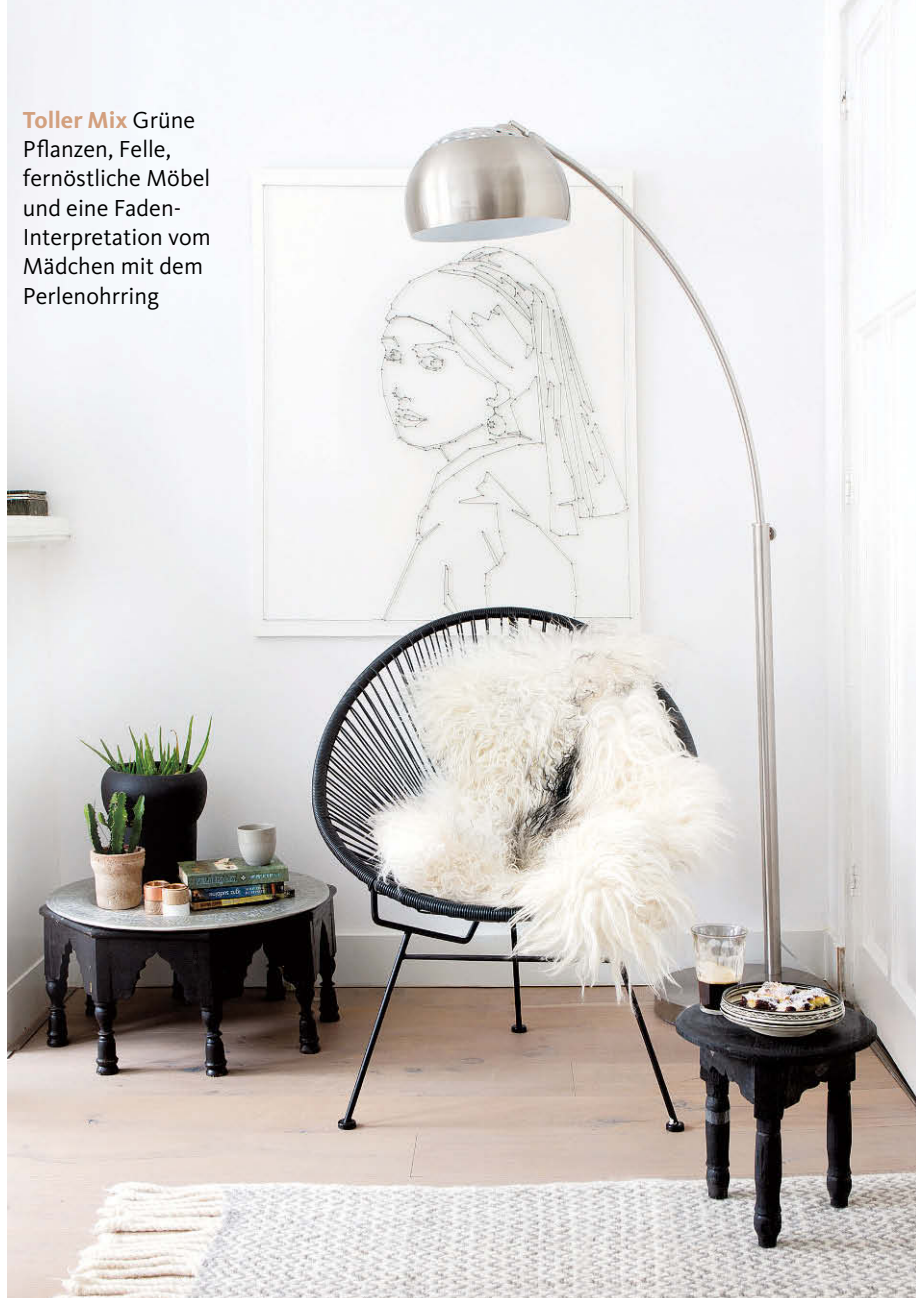
Toller Mix Grüne Pflanzen, Felle, fernöstliche Möbel und eine Faden-Interpretation vom Mädchen mit dem Perlenohrring