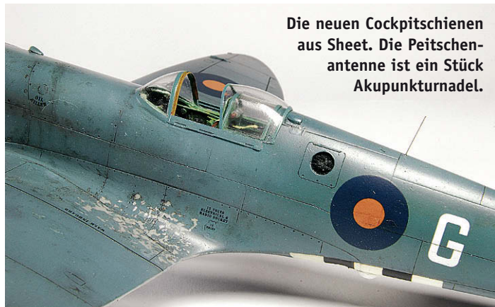
Die neuen Cockpitschienen aus Sheet. Die Peitschenantenne ist ein Stück Akupunkturnadel.

Die typischen Aufklärermerkmale beschränken sich auf drei Kameraöffnungen. Eine sitzt in der linken Rumpffseite hinter dem Cockpit, während zwei weitere im Rumpfboden eingelassen sind. Nach Vorbildfotos gravierte ich zunächst die nach oben zu öffnenden Klappen (je eine auf jeder Rumpffseite versetzt), wobei sich auf der rechten Rumpffseite die gleiche Klappe