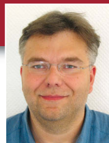
Berthold Tacke Verantw. Redakteur