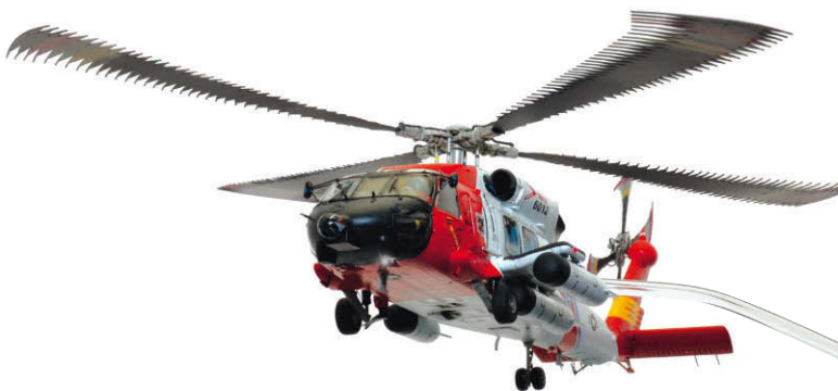
Rettungshelikopter: Jayhawk HH-60 J Wie es gelingt, einen Coast Guard Heli „fliegen“ zu lassen. SEITE 28