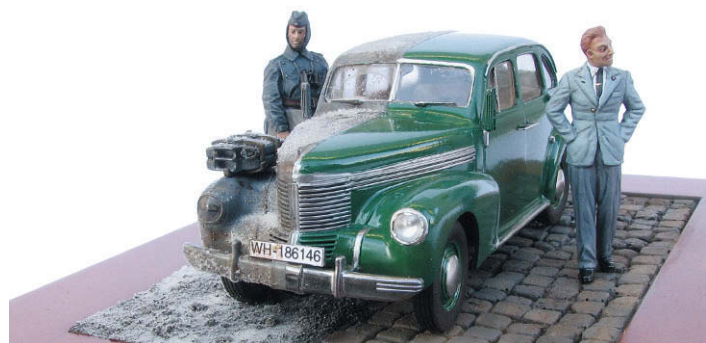
Zwei Gesichter: Opel Kapitän Ein Modell in zivilem und militärischem Dienst – geht das? SEITE 68