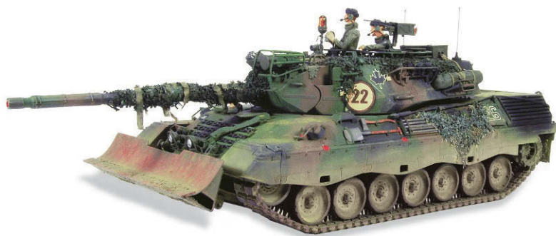
Der mit dem Ahornblatt: Leopard C1 So entsteht ein kanadischer Leopard C1 – Teil 1 SEITE 48