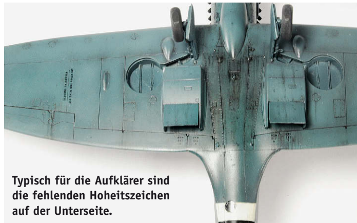
Typisch für die Aufklärer sind die fehlenden Hoheitszeichen auf der Unterseite.