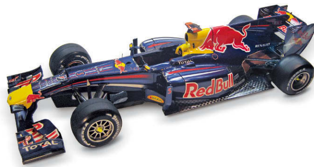
Formel 1 Bolide: Red Bull RB 6 Tamiya präsentiert ein Meisterstück des Formenbaus. SEITE 78

Zwei Gesichter: Opel Kapitän Saloon Staff Car Die umfangreiche Zivilfahrzeugpalette von ICM ist ein Paradies für Fans. Frank Schulz hat sich Gedanken gemacht, wie man ein einziges Fahrzeug in zwei unterschiedlichen Bemalungen ungewöhnlich in Szene setzt.