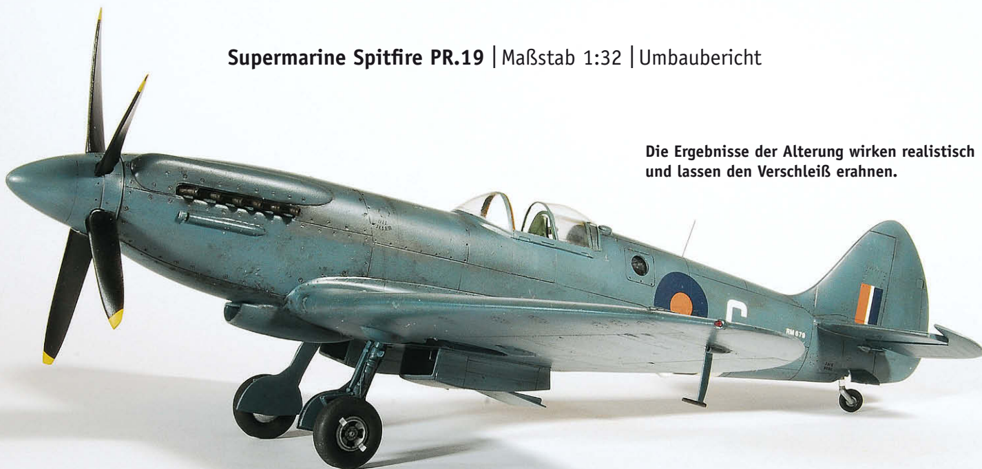
Die Ergebnisse der Alterung wirken realistisch und lassen den Verschleiß erahnen.

D as Short-Run-Modell der Spitfire Mk.XIV von Pacific Coast Models (PCM) bietet einen interessanten Materialmix. Die Kunststoffteile besitzen schöne Gravuren, aber teilweise auch deutlich Grat. Dessen Entfernung beschädigt gelegentlich Details. Auch Zurüstteile, z. B. hervorragende Resin-Teile für Cockpit, Räder und Auspuffstutzen, bedruckte Ätzteile für das Cockpit von eduard sowie Decals von Cartograph werden eingesetzt.