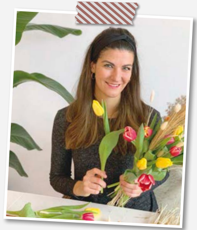
Joana Pauli Produktioner

Das Thema Weihnachtsdeko wird bei mir sehr großgeschrieben. Nachdem ich im Winter wieder mehr Zeit zu Hause verbringe, möchte ich es mir auch besonders schön und gemütlich machen. Wie ich dekoriere, ist von Jahr zu Jahr etwas unterschiedlich, hier gibt es für mich keine altbewährten Bräuche. Je nach Lust und Laune wird es mal etwas traditioneller, mal etwas moderner, ganz natürlich oder auch bunt und funkelnd. Dieses Jahr bin ich definitiv im Team modern. Vor allem schlichte Kränze als Wanddeko haben es mir angetan. Verziert mit einfachen Blättern und Zweigen fügen sie sich perfekt in meine Wohnung ein und sind bis weit über Weihnachten hinaus noch einsetzbar. Interessiert? Dann blättern Sie gleich weiter auf Seite 16!