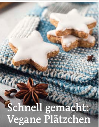
Schnell gemacht: Vegane Plätzchen