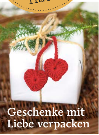
Geschenke mit Liebe verpacken