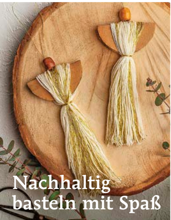
Nachhaltig basteln mit Spaß