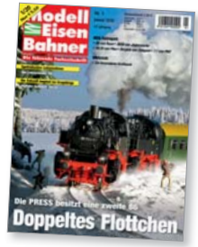
Titel: Zwei 86 von Roco

In wenigen Tagen wird die PRESS mit 86 744 ihre zweite 86 in Betrieb nehmen. Schon einmal kreuzten sich die Wege der beiden Tenderlokomotiven.