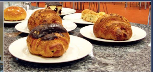
Das gemütliche Bistro lädt zum Verweilen ein, wenn zwischendurch der Hunger kommt.