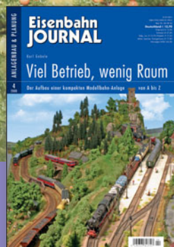
Viel Betrieb, wenig Raum Best.-Nr. 680804 · € 13,70