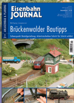
Brückenwälder Bautipps Best.-Nr. 680802 · € 13,70