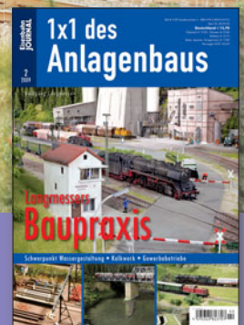
Langmessers Baupraxis Best.-Nr. 680902 · € 13,70