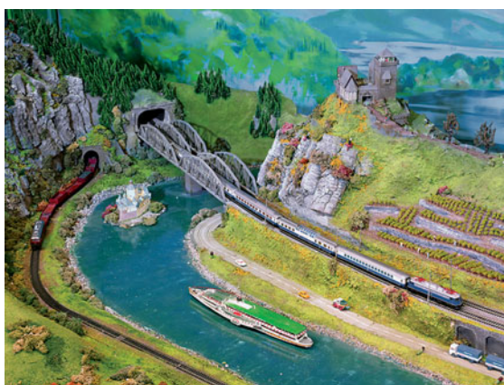
Der Rhein ➔ 34