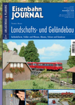
Landschafts- und Geländeabau Best.-Nr. 680803 · € 13,70