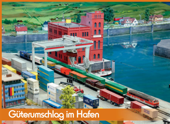
Güterumschlag im Hafen