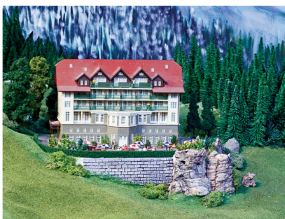
Die Schwarzwaldklinik ➔ 14