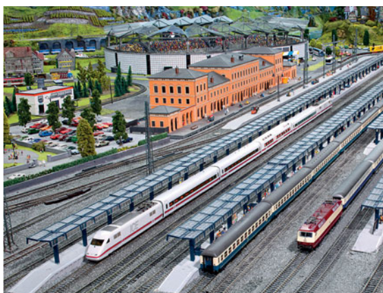
Großstadtbahnhof ➔ 6