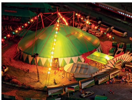
Im Zirkus ➔ 54