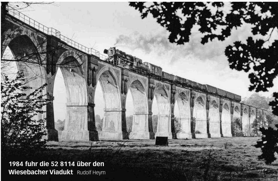
1984 fuhr die 52 8114 über den Wiesebacher Viadukt Rudolf Heym