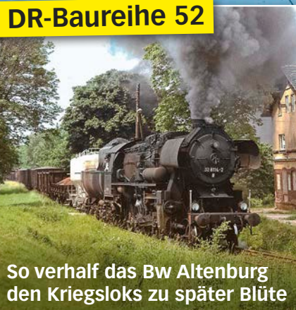
So verhalf das Bw Altenburg den Kriegsloks zu später Blüte