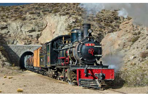
Henschel- und Baldwin-Loks Echte Dampf-Abenteuer in Argentinien