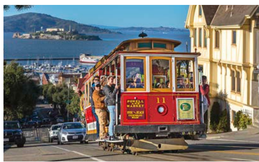
San Franciscos Cable-Cars Faszinierender Technik auf der Spur