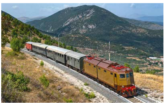
Eisenbahn-Kult und Dolce Vita Was Italien an FS-Historie noch bietet