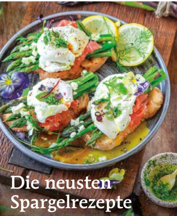
Die neusten Spargelrezepte