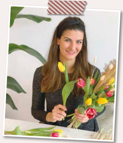
Joana Pauli Produktioner

Do-it-yourself-Projekte aus recycelten Dingen sind für mich weit mehr als einfach nur Basteln. Es vereint nicht nur meine persönliche Kreativität mit dem Nachhaltigkeitsaspekt, sondern stellt mich auch vor die Herausforderung aus scheinbarem Abfall etwas Nützliches, Neues zu gestalten. Vor allem alte Dosen oder Getränkekartons haben es mir angetan. Hier lassen sich unglaublich viele verschiedene und vor allem individuelle neue Dinge gestalten wie Vasen, Stifthalter, Blumentöpfe oder Windlichter. Das Schöne daran ist, dass ich nicht ständig teure Deko-Elemente für jede Jahreszeit oder die neuesten Farbtrends kaufen muss. Ich gestalte sie mir einfach ganz nach meinen eigenen Wünschen und Vorstellungen selbst!