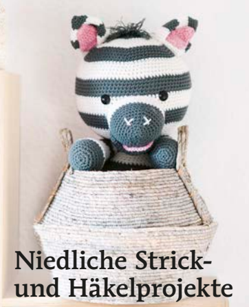
Niedliche Strick- und Häkelprojekte