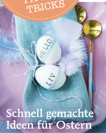
Schnell gemachte Ideen für Ostern