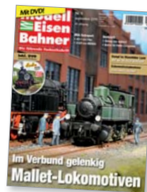
Titel: Bay. BBII von Roco in H0, 96 von Märklin in H0

Ein geteilter Rahmen, zwei Hochdruck- und zwei Niederdruckzylinder: Im späten 19. Jahrhundert war diese Bauart das Nonplusultra der Dampfloktechnik.