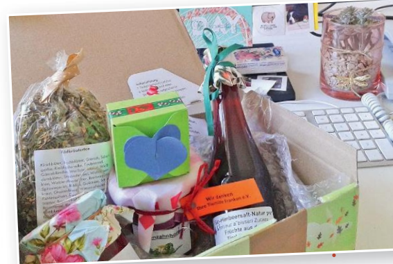
Vielen Dank! Dieses sensationelle Überraschungspaket sendete uns die Tierhilfe Franken e.V. in die Redaktion