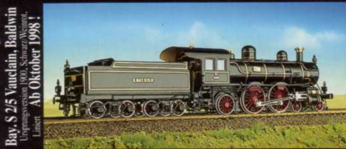
Bay. S 2/5 Vaucrain, Baldwin Ursprungsversion 1900, Schwarz/Weiß, Liniert Ab Oktober 1998!