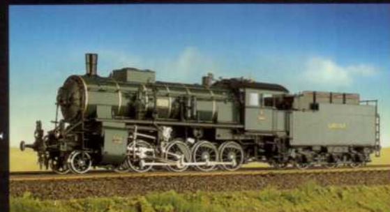
! MICRO-METAKIT ! Prospektsatz 1998/99 KOSTENLOS ANFORDERN

Vollständig nachgebildete Vierzylinder-Triebwerke