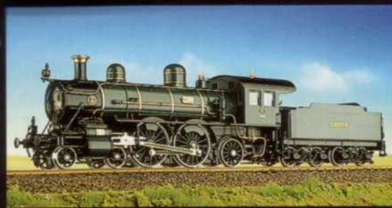
Bay. S2/5 Vaucrain, Baldwin 4 Bayerische Versionen 1 Gruppenverwaltung Bayern 1 Reichsbahn-Version Ab Oktober 1998!