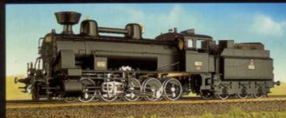
3 KkSLB. Versionen 1 BBO. Version 1 DRG. Version 1 FS. Version Ab August 1998!

Österreichische Reihe 180. DRG. BR. 57 001