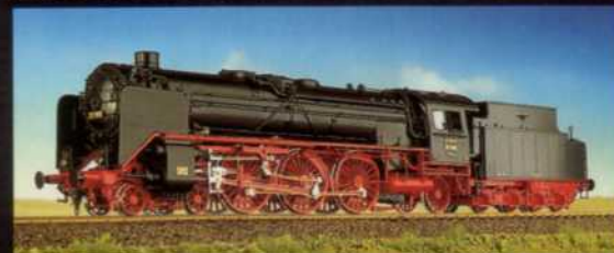
DRG. BR 02 4 Reichsbahn-Versionen Supermodell Ab November 1998!

Österreichische Reihe 180. DRG. BR. 57 001