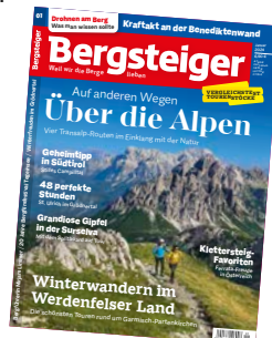
Cover: Belluneser Dolomiten mit Monte Pelmo