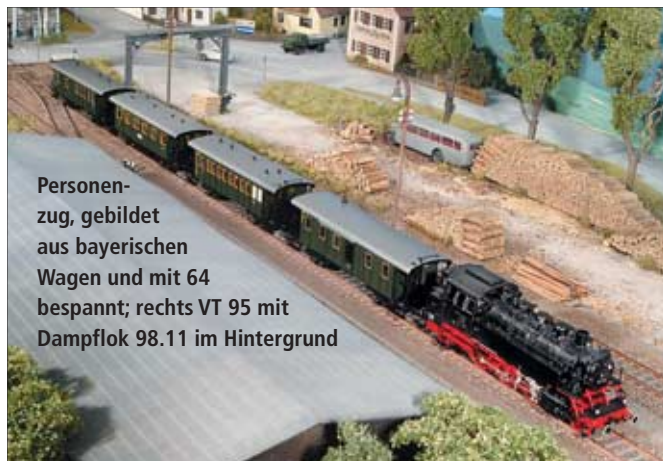
Personenzug, gebildet aus bayerischen Wagen und mit 64 bespannt; rechts VT 95 mit Dampflok 98.11 im Hintergrund

Auf dem Reststück nach Lanzendorf verkehrte 2002 nach der V 60 noch die Baureihe 294, und bis zur Stilllegung im August 2006 wurde das Gaswerk dort von der Regentalbahn mit einer Vossloh-G-2000 bedient. Für den Modelleisenbahner ist daher einiges geboten.