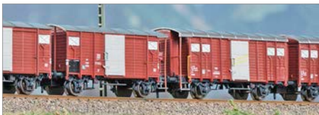
Q-04: Hobbytrain K2- und K3-Wagen SBB