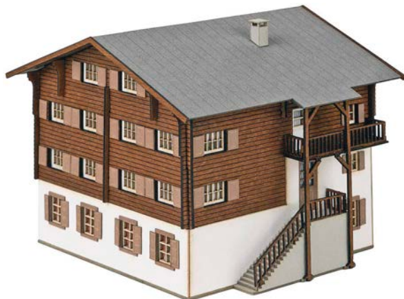
Faller: Wohnhaus Langwies

Zubehör: Eine sehr markante Neuheit ist der Bausatz des Bodenseeschiffes „Österreich“. Bei den Gebäuden erscheinen unter anderem für