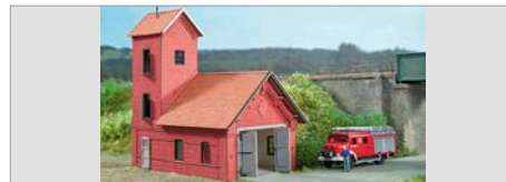
V-07: Nordmodell Feuerwache in N