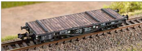
Q-05: Liliput SSys Köln DRG/DR/DB