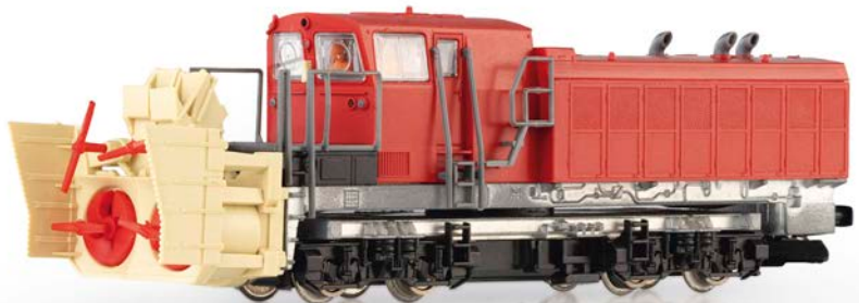
Fleischmann: Produktionsmuster der Beilhack Schneeschleuder