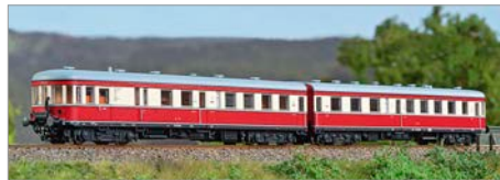
H-05: Kres VT 137 Stettin DB/DR