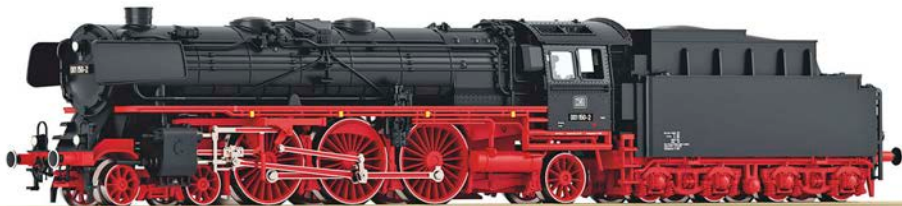
Fleischmann: Fotomontage der DB 01 150