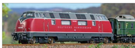
H-08: Minitrix V200002 DB