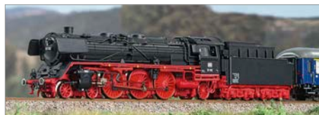
H-02: Fleischmann 01 DB/DRG