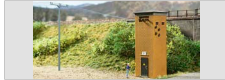
V-01: Auhagen Trafohäuschen in N