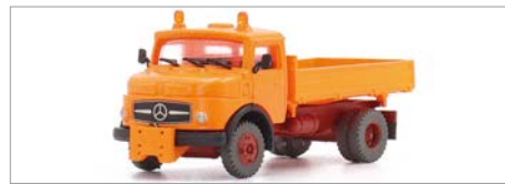
V-03: FKS MB-Kurzhauber in N