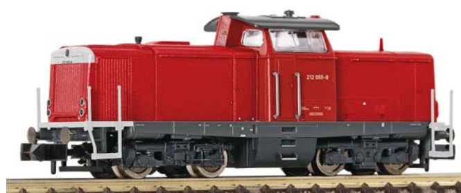
Fleischmann: Produktionsmuster der DB AG 212

alpenländische Anlagen ein großes Wohnhaus Langwies in Holzbauweise und für den süddeutschen Raum ein Dorfbauernhaus mit angebautem Holzschuppen. Im Detailzubehör gibt es Werkstatteinrichtungen, Paletten mit Hubwagen, Gastanks, Müllcontainer und -tonnen, eine DHL-Packstation und zwei Figurensätze mit Bauarbeitern oder Kühen, Pferden und Schafen. Für das Car System wird der MB O 302 Reisebus im Touring-Design aufgelegt.