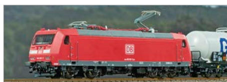
H-09: Piko 185 Traxx 1 DB AG