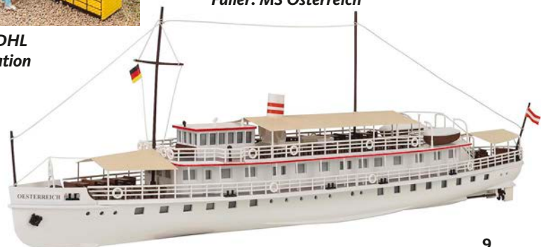
Faller: MS Österreich