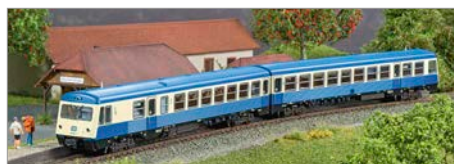
H-07: Liliput 628.0 DB