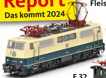
111 von Minitrix