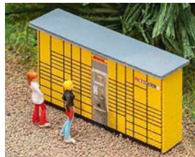
Faller: DHL Packstation