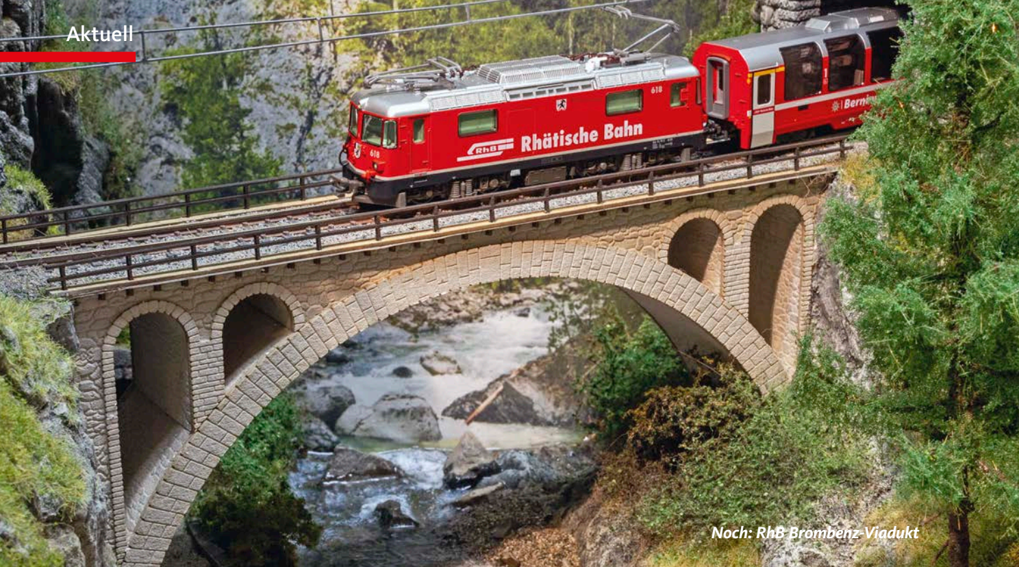
Noch: RhB Brombenz-Viadukt

■ Aktuelle Neuankündigungen für Fahrzeuge, Zubehör und Technik