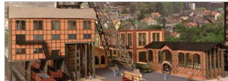
V-05: Modellbahn Union Zechen- Bausätze in N