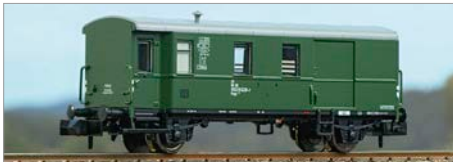
Q-03: Fleischmann Pwgs 041 DB/DR