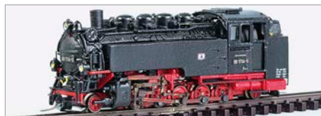
H-06: Lemiso 99.72 DR in Ne