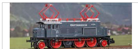
H-10: Jägerndorfer 1073/E33 BBÖ