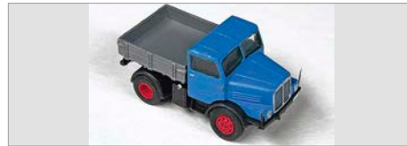
V-09: RST-Eisenbahn- modellbau DDR-Autos 3D Druck in N