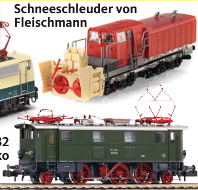
E 32 von Piko