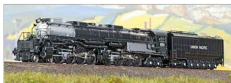
H-04: Kato Big Boy UP