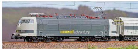
H-01: Arnold 103 DB/Rail Adventure