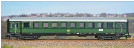
Q-06: Minitrix Schürzen- Eilzugwagen DB