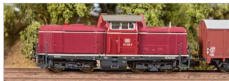
H-03: Fleischmann 211 DB