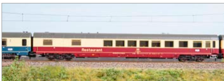
Q-07: Piko IC 79-Wagen DB