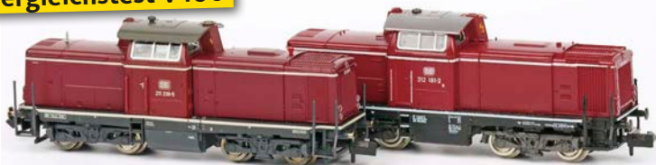
Ablösung nach 50 Jahren: So gut ist Fleischmanns Neuheit