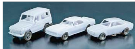
V-06: Minichamps 3D-Druck-Autos in TT und N