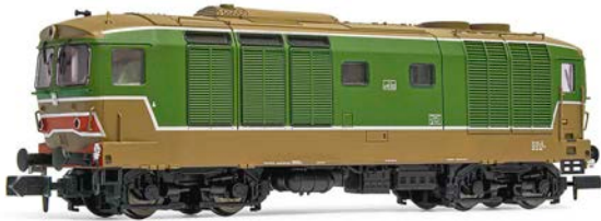
Arnold: Projekt- bild der FS D 445