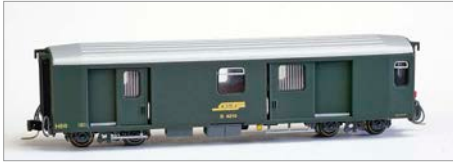
Q-01: AB-Modell Gepäckwagen EWI RhB in Nm