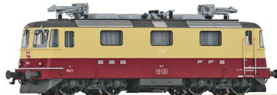
Fleischmann: Fotomontage der SBB Re 4/4 II