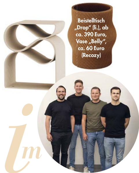
Beistelltisch „Drop“ (li.), ab ca. 390 Euro, Vase „Belly“, ca. 60 Euro (Recozy)

„Pireus“, 46 x 100 x 35 cm, ca. 190 Euro (Nordlys über Maisons du Monde)