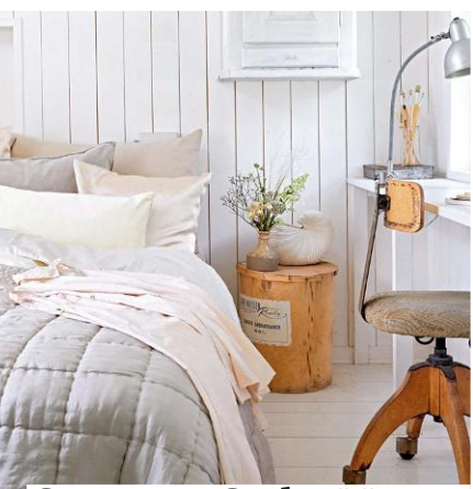
Sommer-Style: Natur trifft frische Brise