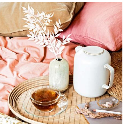
Gute-Laune-Stoffe für ein schönes Zuhause