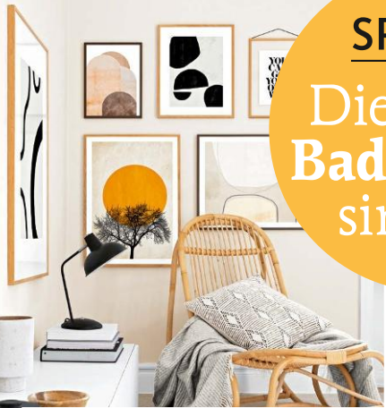
Bilder kreativ in Szene setzen - so geht's

Wir genießen die Outdoor-Saison Möbel & Accessoires, die jetzt IN sind