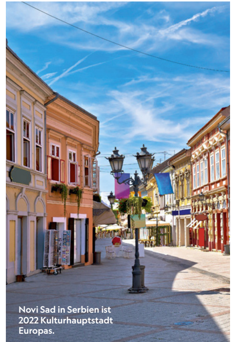
Novi Sad in Serbien ist 2022 Kulturhauptstadt Europas.

Als erstes Land in Europa verbietet Spanien an allen seinen Stränden das Rauchen. Das im Dezember verabschiedete Gesetz geht auf eine Petition zurück, die 283.000 Menschen unterschrieben haben, und soll für saubere Strände sorgen. Wer sich trotzdem eine Zigarette ansteckt, riskiert Strafen bis zu 2000 Euro. Laut Europäischer Umweltagentur sind Zigarettenstummel eine der häufigsten Verunreinigungen von Stränden. An beliebten Badeplätzen auf den Kanaren und bei Barcelona ist das Rauchen daher bereits seit einiger Zeit verboten, ebenso in Teilen Südfrankreichs und auf Sardinien.