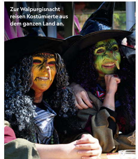
Zur Walpurgisnacht reisen Kostümierte aus dem ganzen Land an.