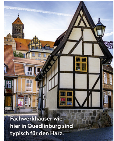
Fachwerkhäuser wie hier in Quedlinburg sind typisch für den Harz.