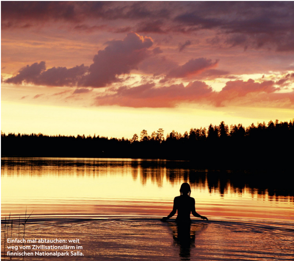
Einfach mal abtauchen: weit weg vom Zivilisationslärm im finnischen Nationalpark Salla.

SAUBER IN VERSCHIEDENSTER HINSICHT SIND DIE NEUIGKEITEN AUS DER REISEWELT: RAUCH- VERBOT AM STRAND, EIN NEUER NATIONALPARK UND DIE SICHERSTE AIRLINE DER WELT.