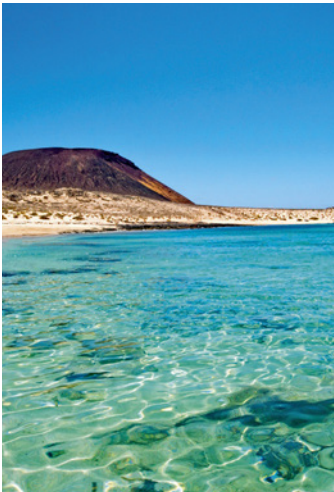
Klares Wasser, sauberer Sand und gesunde Meerestiere: Dafür sorgt das Rauchverbot an Spaniens Stränden.

der Deutschen machten 2021 trotz Pandemie Urlaub, knapp die Hälfte davon im Ausland, so eine Umfrage von urlaubspiraten.de . Etwa ein Viertel buchte weniger als einen Monat im Voraus.