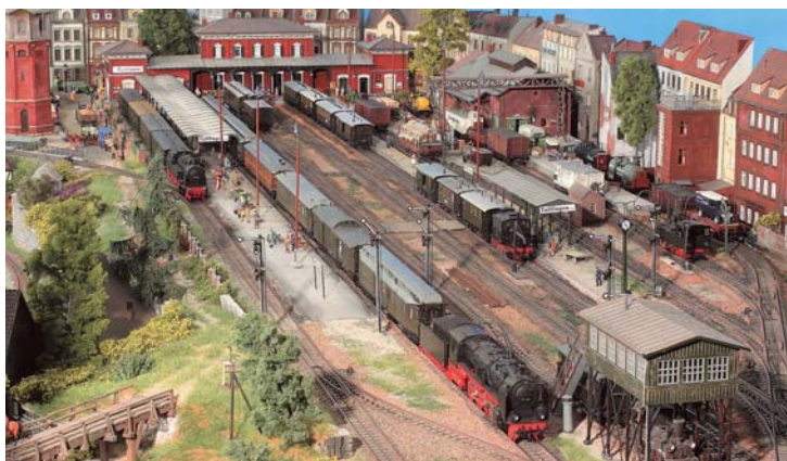
Anlagenporträt Kopfbahnhof: Wendepunkt ➔ 58