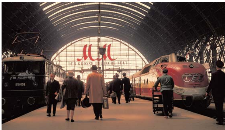
Titelthema TEE: Europas erste Garnituren ➔ 12