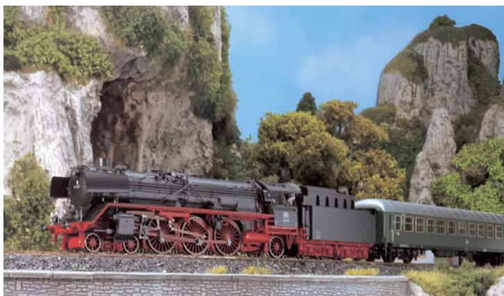
BR 01 von Märklin: Die lang Vermisste ➔ 54