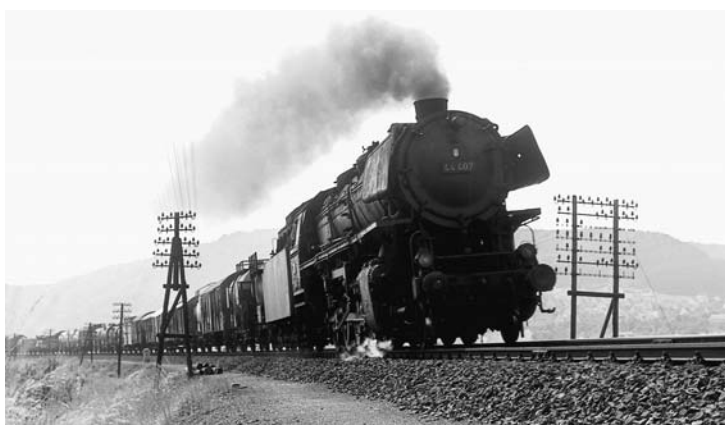
Main-Weser-Bahn-Historie: Damals in Marburg ➔ 24