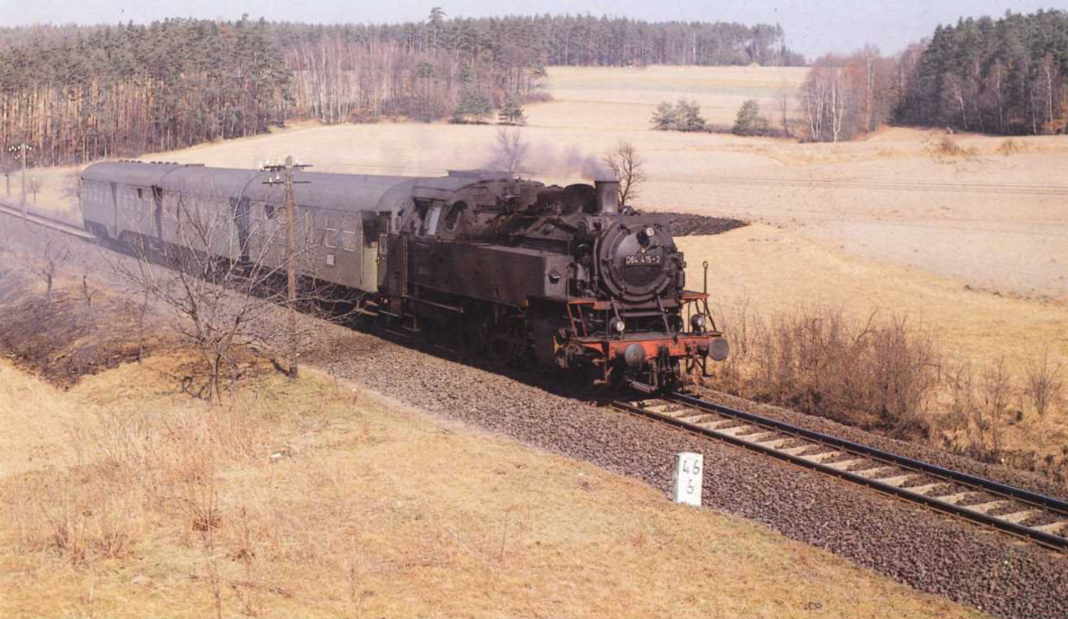
Bild 4: Vor einem Personenzug von Bayreuth nach Kirchenlaibach wurde hier die 064 415 bei Seybothenreuth im Bild festgehalten. Die Lokomotive entstammt einer Lieferserie, die an Treib- und Kuppelrädern mit Scherenbremsen ausgerüstet wurde.