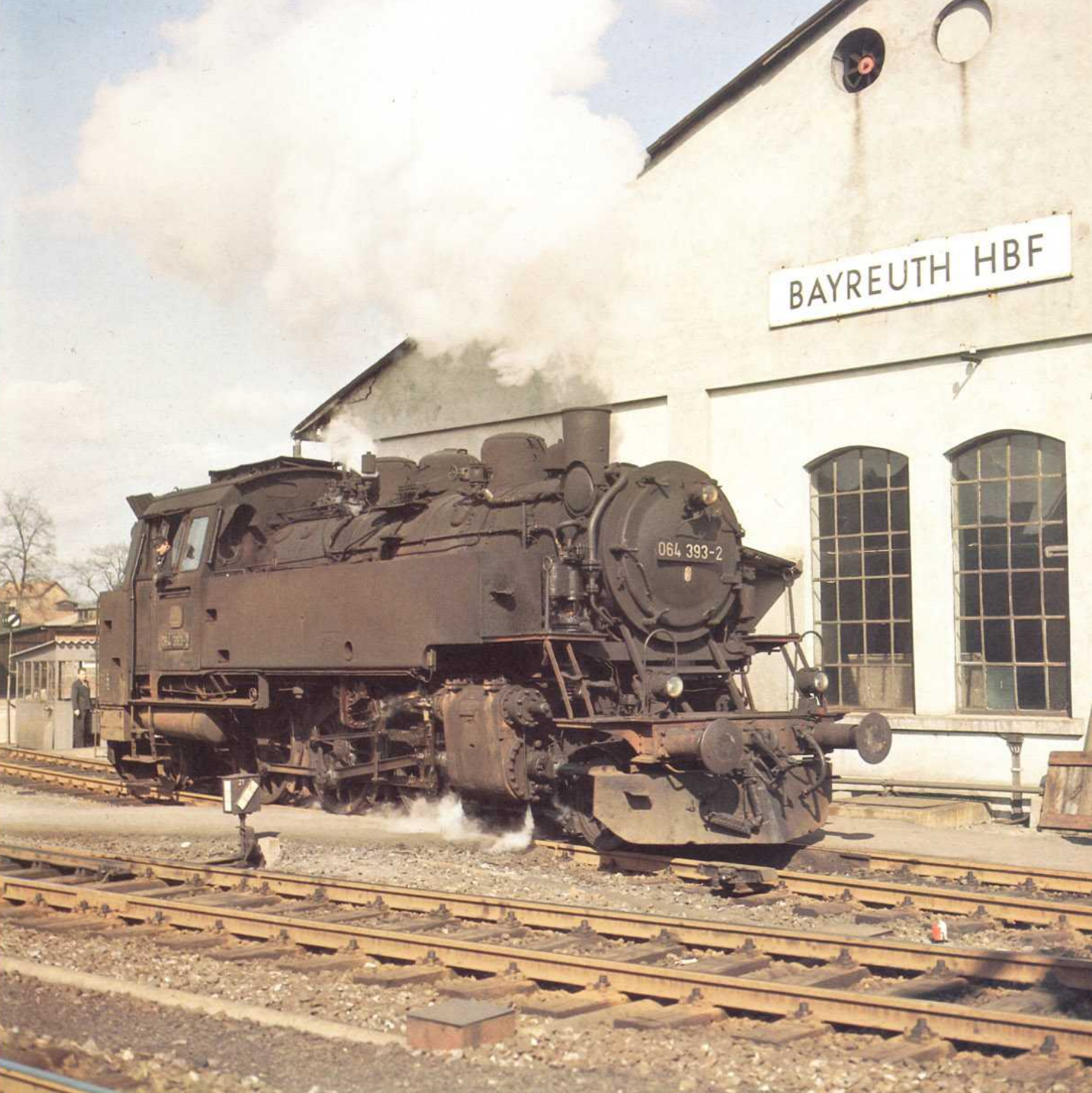
Bild 8: Die 064 393 setzt sich in Bayreuth Hbf vor einen Zug nach Kirchenlaibach. Sie wurde 1936 von der Maschinenfabrik Esslingen an die Deutsche Reichsbahn geliefert.

und VI c, in Sachsen die Gattung XIV HT, und in Württemberg war die Gattung T 5 lange Zeit unentbehrlich. Nur in Bayern konnte man sich mit dieser Achsanordnung nie anfreunden. Als dann die Hauptverwaltung der Deutschen Reichsbahn den Bau von Einheitslokomotiven in die Wege geleitet hatte, entstanden zunächst die großen Schlepptenderlokomotiven der Baureihen 01/02 und 43/44. Bald folgten dann aber auch die ersten Tenderlokomotiven aus dem bereits festgelegten Typenplan. Darunter befand sich auch eine 1'C1'-Personenzugtenderlokomotive. Sie sollte dazu beitragen, den Verkehr auf Nebenbahnen schneller und wirtschaftlicher abzuwickeln. Feste Vorgaben für die neue Baureihe 64 waren eine