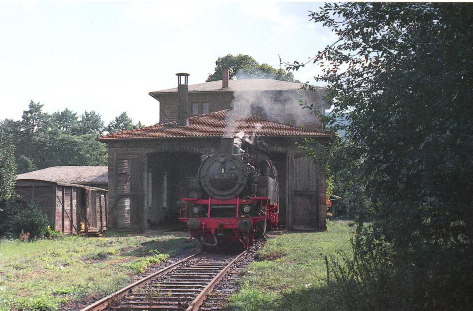
Bild 12: Über 45 Jahre war die Baureihe 64 in Aschaffenburg beheimatet. Nur vier Jahre lang zählte die 064 305 zum Bestand dieses Bahnbetriebswerkes. Am 16. September 1971 wurde sie vor dem Lokschuppen in Miltenberg fotografiert.