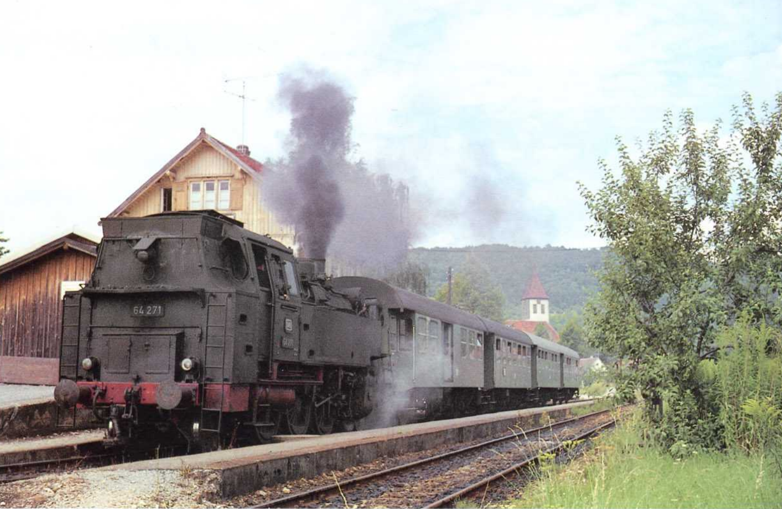
Bild 11: 1965 war die 64 271 beim Bw Aalen beheimatet. Mit einem Personenzug nach Schorndorf wurde diese Tenderlok im gleichen Jahr im Bahnhof Welzheim aufgenommen.