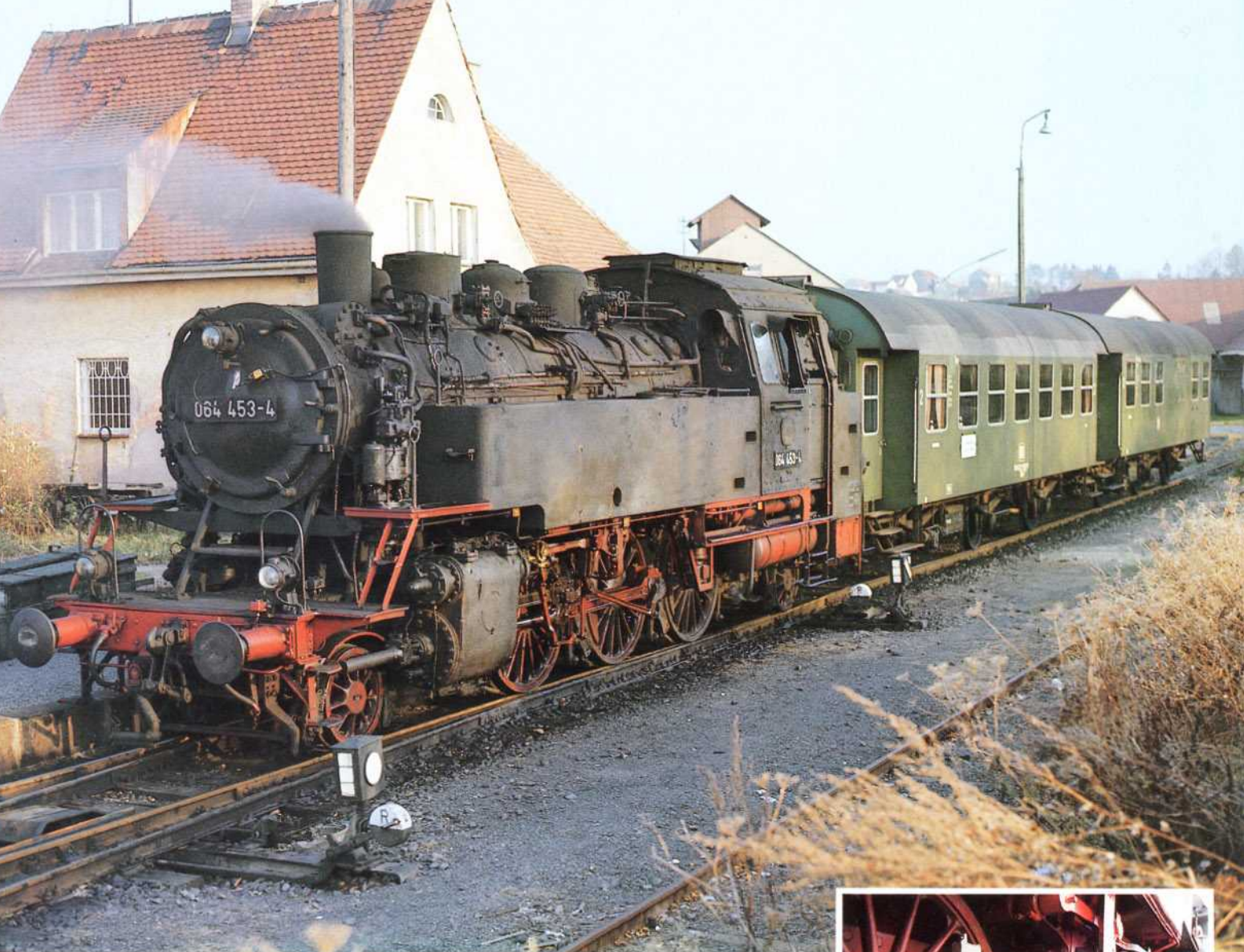
Bild 1 (linke Seite oben): Über Jahrzehnte hinweg bestimmten die Tenderlokomotiven der Baureihe 64 das Erscheinungsbild vieler Nebenbahnzüge: Die 064 453 des Bw Weiden ist hier Zuglok eines aus zwei Umbauwagen gebildeten Personenzuges, der in Eslarn aufgenommen wurde.