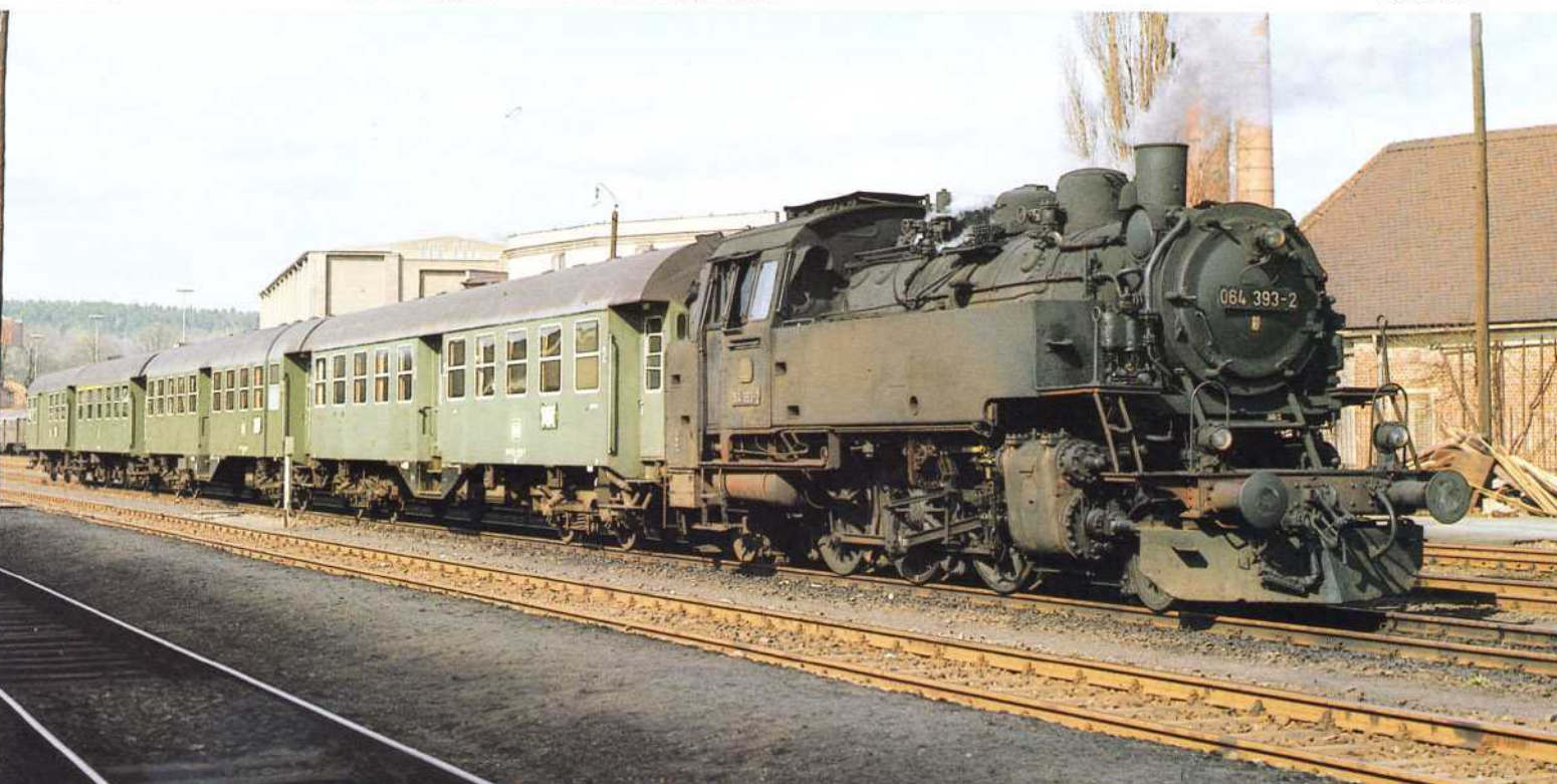
Bild 5: In Bayreuth begegnete dem Fotografen am 4. April 1973 die 064 393 des Bw Weiden. Bereits ein Jahr später wurde die Lokomotive ausgemustert.

mit der Achsfolge 1'C1'. Von dieser Bauart versprach man sich besonders gute Laufeigenschaften in beiden Fahrtrichtungen. In Baden bewährten sich die Gattungen VI b