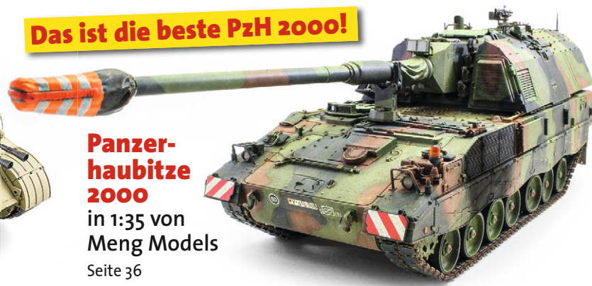
Panzer- haubitze 2000 in 1:35 von Meng Models Seite 36