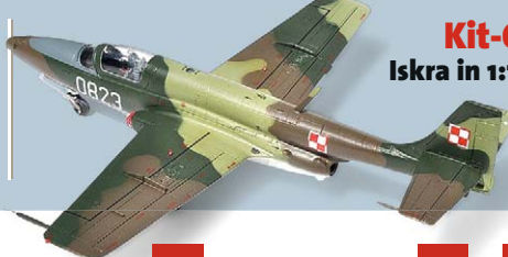
Kit-Oldie Iskra in 1:72 von ZTS Seite 26