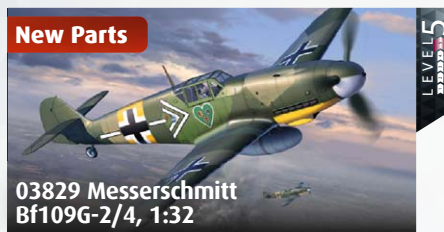
03829 Messerschmitt Bf109G-2/4, 1:32