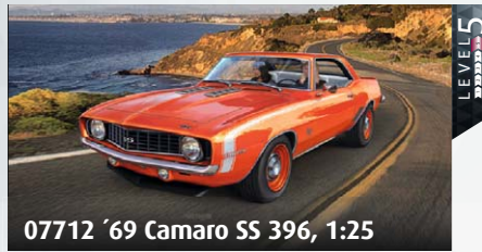
07712 '69 Camaro SS 396, 1:25