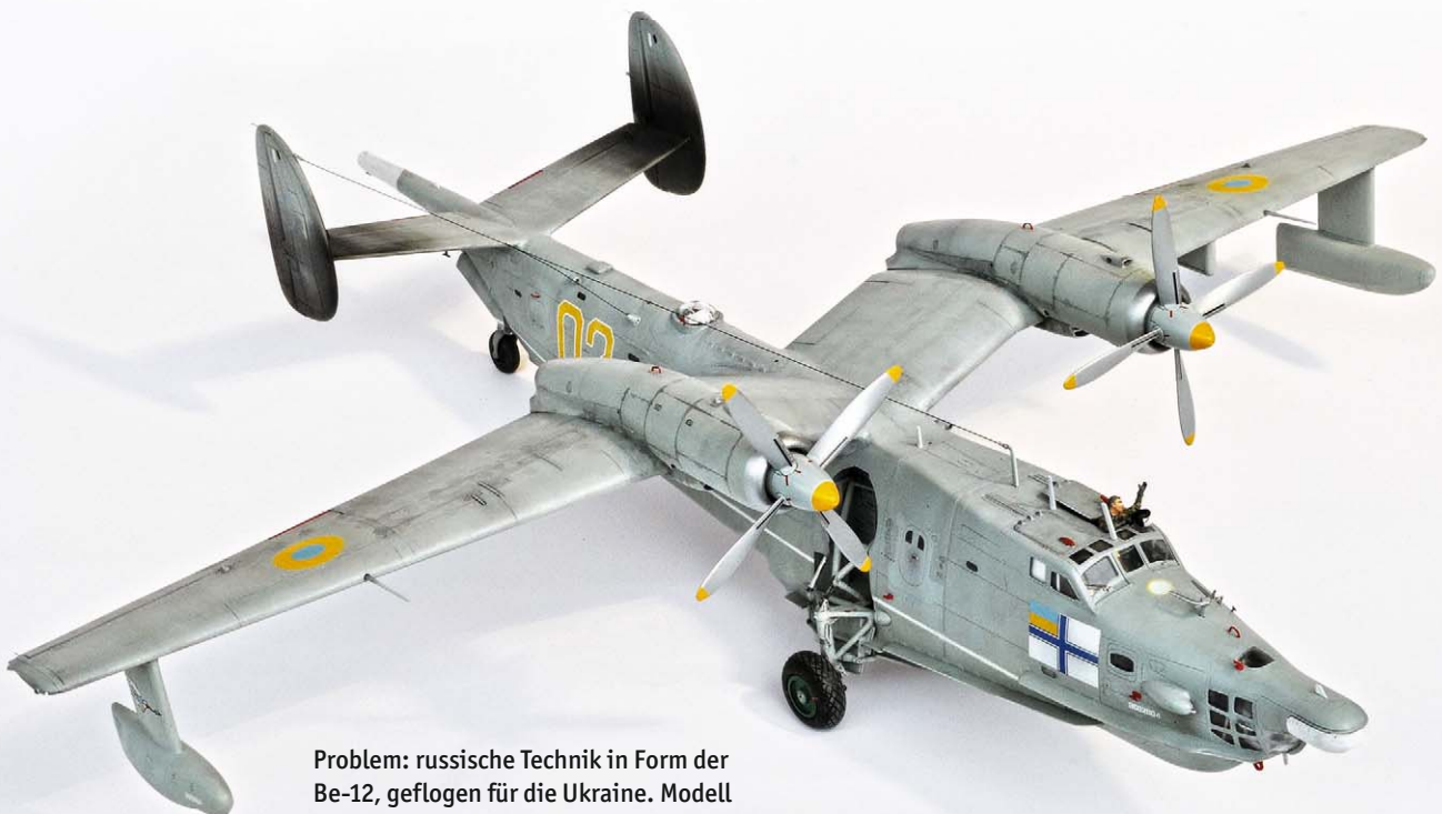
Problem: russische Technik in Form der Be-12, geflogen für die Ukraine. Modell von Hersteller: Modelsvit aus der Ukraine

„Kleine Fluchten.“ „Das bietet Modellbau“