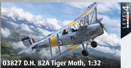
03827 D.H. 82A Tiger Moth, 1:32