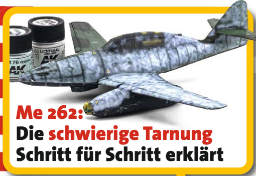
Me 262: Die schwierige Tarnung Schritt für Schritt erklärt

Das führende deutschsprachige Magazin für Plastikmodellbau