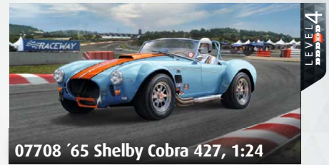
07708 '65 Shelby Cobra 427, 1:24