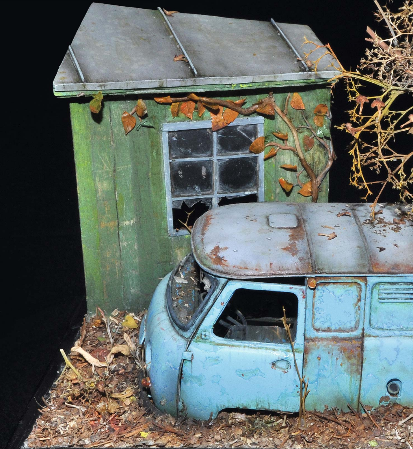
Pripyat decay: UAZ-452