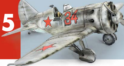
Winter- tarnung I-16 in 1:32 von ICM Seite 18