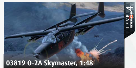
03819 O-2A Skymaster, 1:48