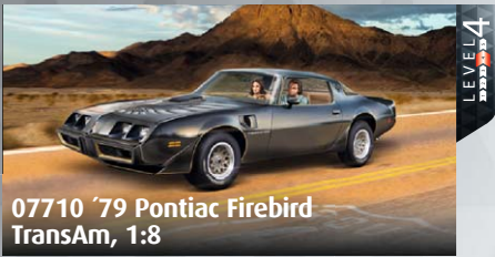
07710 '79 Pontiac Firebird TransAm, 1:8