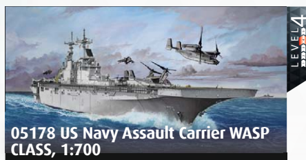
05178 US Navy Assault Carrier WASP CLASS, 1:700