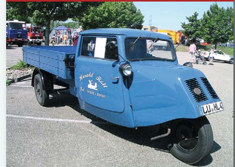
Das Tempo-Dreirad war auch nach dem Krieg fleißig im Einsatz, die Marke landete später bei Hanomag, diese dann bei Mercedes