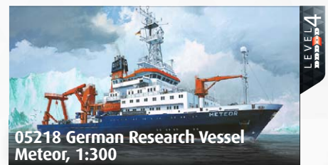
05218 German Research Vessel Meteor, 1:300