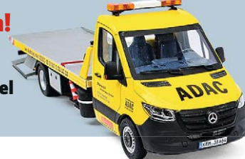
Endlich! ADAC- Sprinter im Handel Seite 64

Mai 2022 | € 7,90 A: € 8,70 | CH: sFr. 14,00 BeNeLux: € 9,20