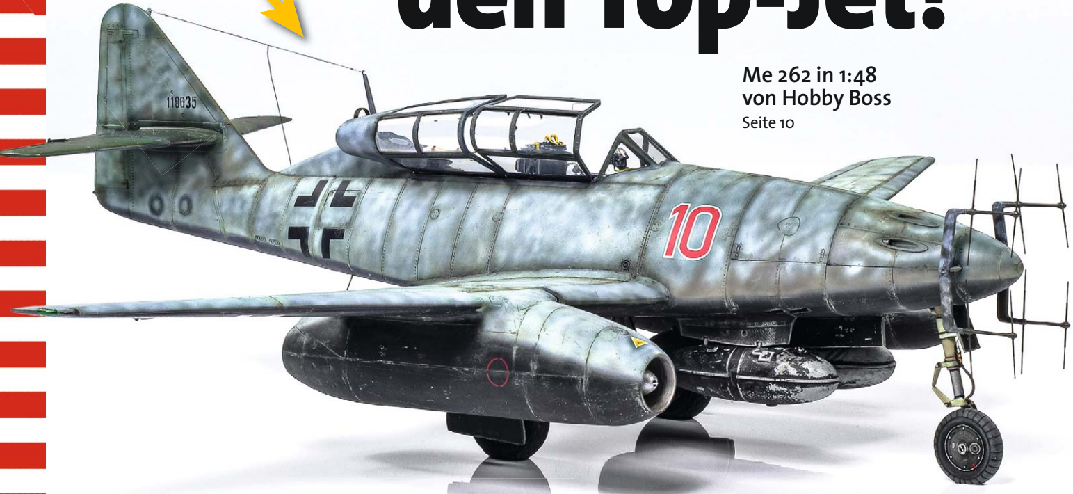
Me 262 in 1:48 von Hobby Boss Seite 10