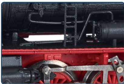
Vorbildgetreuer, freier Durchblick zwischen Kessel und Fahrwerk