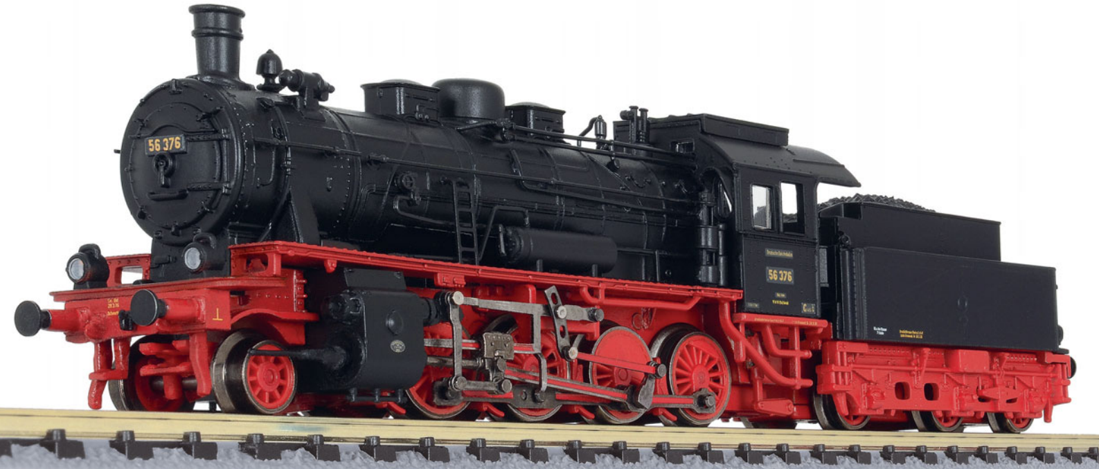
Schleptenderlokomotive Baureihe 56 2-8 , DRG Liliput-Art.-Nr. L161560

Jedem Anfang wohnt ein Zauber inne – die erste Dampflokomotive von Liliput in Spurweite N