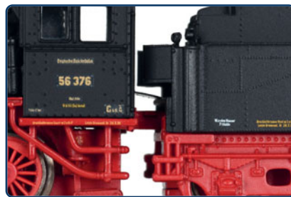
Elektrisch leitende Kurzkupplungs- kinematik zwischen Lok und Tender