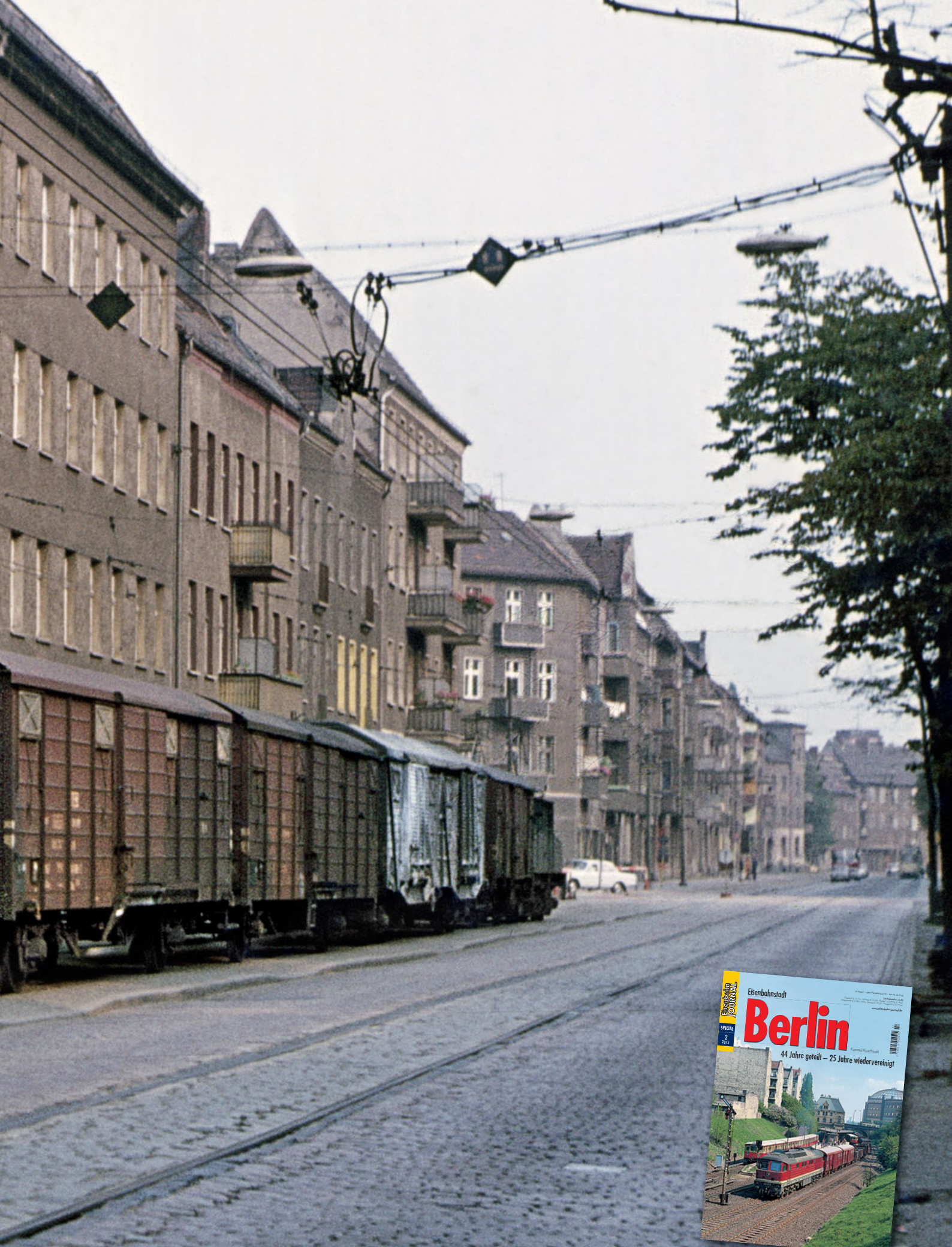
Nur eine kleine Facette der Eisenbahnstadt Berlin war die ehemalige Industriebahn Oberschönevide, die u.a. durch die dortige Edisonstraße führte. Am 31. Juli 1977 ist hier vor der morbide anmutenden Kulisse trister Wohnblocks, karger Ladengeschäfte und fast menschenleerer Gehsteige ein Güterzug mit zwei E-Loks unterwegs. Weitere Fakten und ausdrucksstarke Perspektiven zur Eisenbahn in Berlin bietet unser aktuelles EJ-Special!