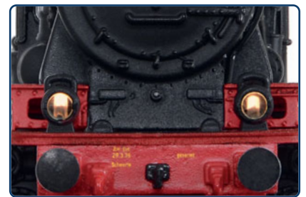
Warmweiße LED-Beleuchtung an Lok (und Tender)