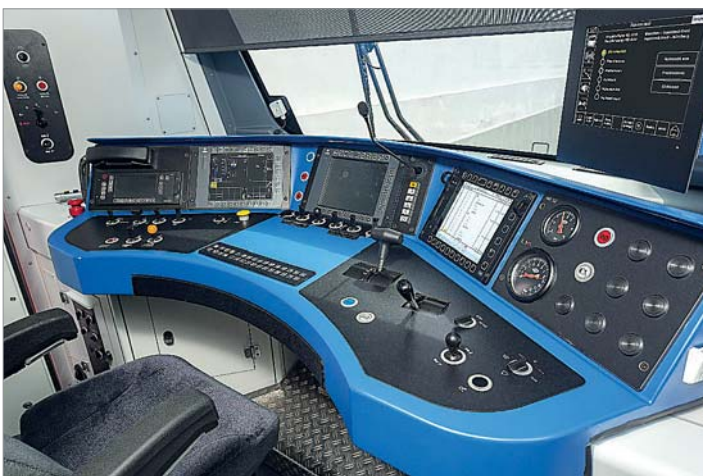
Der Führerstand der neuen Baureihe 102 wirkt vertraut. Der Triebfahrzeugführer sitzt in der Fahrzeugmitte.

Das Pilsener Unternehmen Škoda Transportation setzt eine lange Tradition der Herstellung elektrischer Lokomotiven fort, von denen es in seiner Geschichte mehr als 5000 Stück produziert hat. Die neuesten „Emil Zátopek“-Lokomotiven sind derzeit in der Tschechischen Republik und in der Slowakei in Betrieb. Als zweite weltweit haben sie das europäische TSI-(Technische Spezifikationen für die Interoperabilität)-High-Speed-RST-Zertifikat erhalten. Die Lokomotiven für Deutschland erfüllen alle anspruchsvollen technischen Parameter und die neuesten europäischen TSI-Sicherheitsvorschriften. Ihre Maximalgeschwindigkeit beträgt 200 km/h. Die Teile und Rohstoffe, aus denen die Lokomotive gebaut wurde, sind zu mehr als 95 Prozent wiederverwertbar.