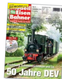
Titel: DEV-Lok Franzburg in Vilsen-Ort

...ging vor einem halben Jahrhundert schon ihrem Ende entgegen. Engagierte gründeten daher 1966 in Bruchhausen-Vilsen die erste deutsche Museumsbahn.