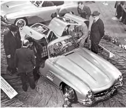
International Motor Sports Show in New York, Februar 1954: Zwei heute legendäre Fahrzeuge zeigen sich erstmals der Öffentlichkeit, Mercedes-Benz 300 SL und 190 SL (oben, angeschnitten).

Vor 70 Jahren, im Februar 1954, debütierten auf der International Motor Sports Show in New York der Mercedes-Benz 190 SL (W 121) und der 300 SL „Gullwing“ (W 198). Der 190 SL sollte nahe an seinen „großen Bruder“, den 300 SL Flügeltürer, heranrücken. Die Fahrleistungen waren allerdings deutlich geringer (77 kW/105 PS gegenüber 158 kW/215 PS). Daimler-Benz bezeichnete den 190 SL deshalb in den Prospekten als „Touren-Sportwagen“. Prominente Besitzer eines 190 SL waren unter anderem Gina Lollobrigida, Ringo Starr, Grace Kelly und Romy Schneider – die übrigens auch einen 300 SL ihr Eigen nannte. Der 190 SL und der 300 SL gehören heute zu den begehrtesten automobilen Klassikern am Oldtimermarkt.