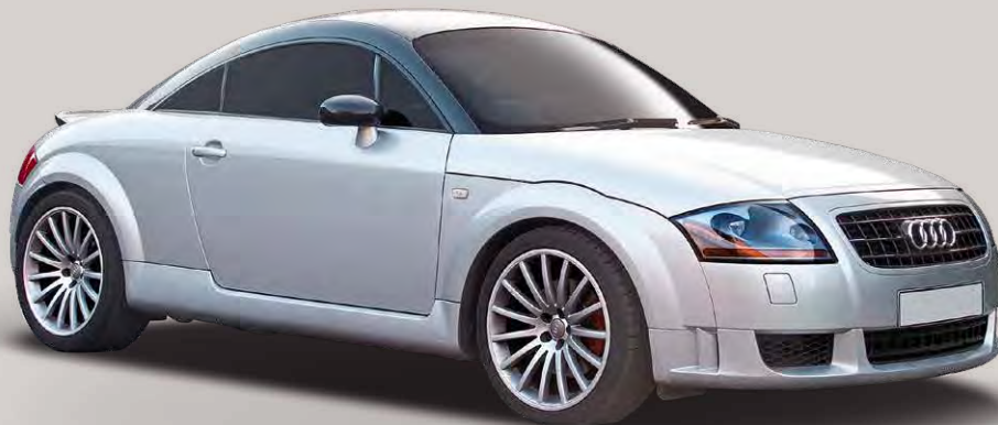
Sein charakteristisches Design und die klare Formensprache machen den Audi TT so einzigartig.

D er Audi TT ist tot“ – diese Schlagzeile war häufig zu lesen, nachdem am 10. November 2023 das letzte von insgesamt 662.762 Fahrzeugen der TT-Baureihe bei Audi vom Band gerollt war. Der Audi TT wurde als Coupé und Cabrio verkauft – die Coupé-Studie von 1995 ging 1998 in Serie. Bis 2006 wurden 178.765 Audi TT Coupé der ersten Generation hergestellt. Für ihr Design, über das Audi-Designer Torsten Wenzel einmal sagte, „der Audi TT ist eine fahrende Skulptur“, hagelte es Design-Preise. Gute Indikatoren für ein ikonisches Fahrzeug mit dem Potenzial zum künftigen Klassiker.