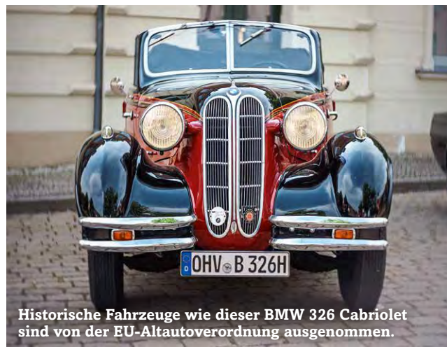
Historische Fahrzeuge wie dieser BMW 326 Cabriolet sind von der EU-Altautoverordnung ausgenommen.