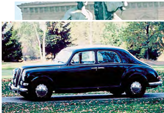
Ikonische Lancia-Modelle wie Aurelia (kl. Foto, ab 1950) und die Flaminia (ab 1957) zeigt die diesjährige Sonderschau Auto bei der Bremen Classic Motorshow.