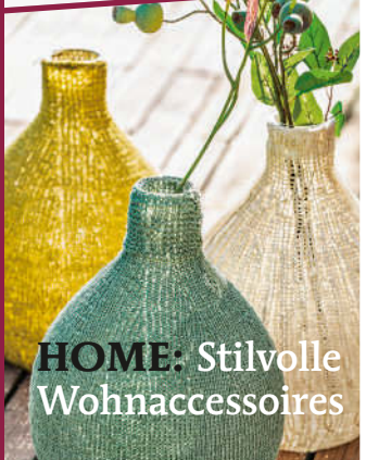
HOME: Stilvolle Wohnaccessoires

Kuschelzeit Strick-Hits für Starter & Könner