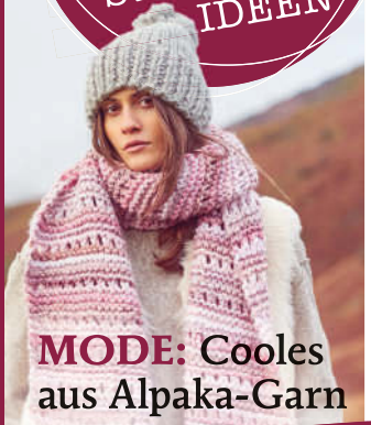
MODE: Cooles aus Alpaka-Garn

Ausführliche Anleitungen und tolle EXTRA-TIPPS