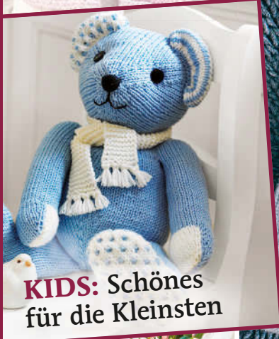
KIDS: Schönes für die Kleinsten