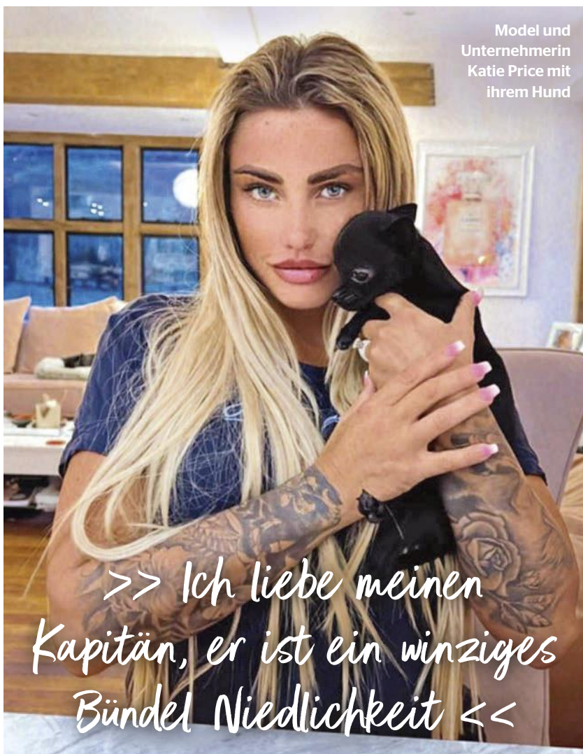
Model und Unternehmerin Katie Price mit ihrem Hund