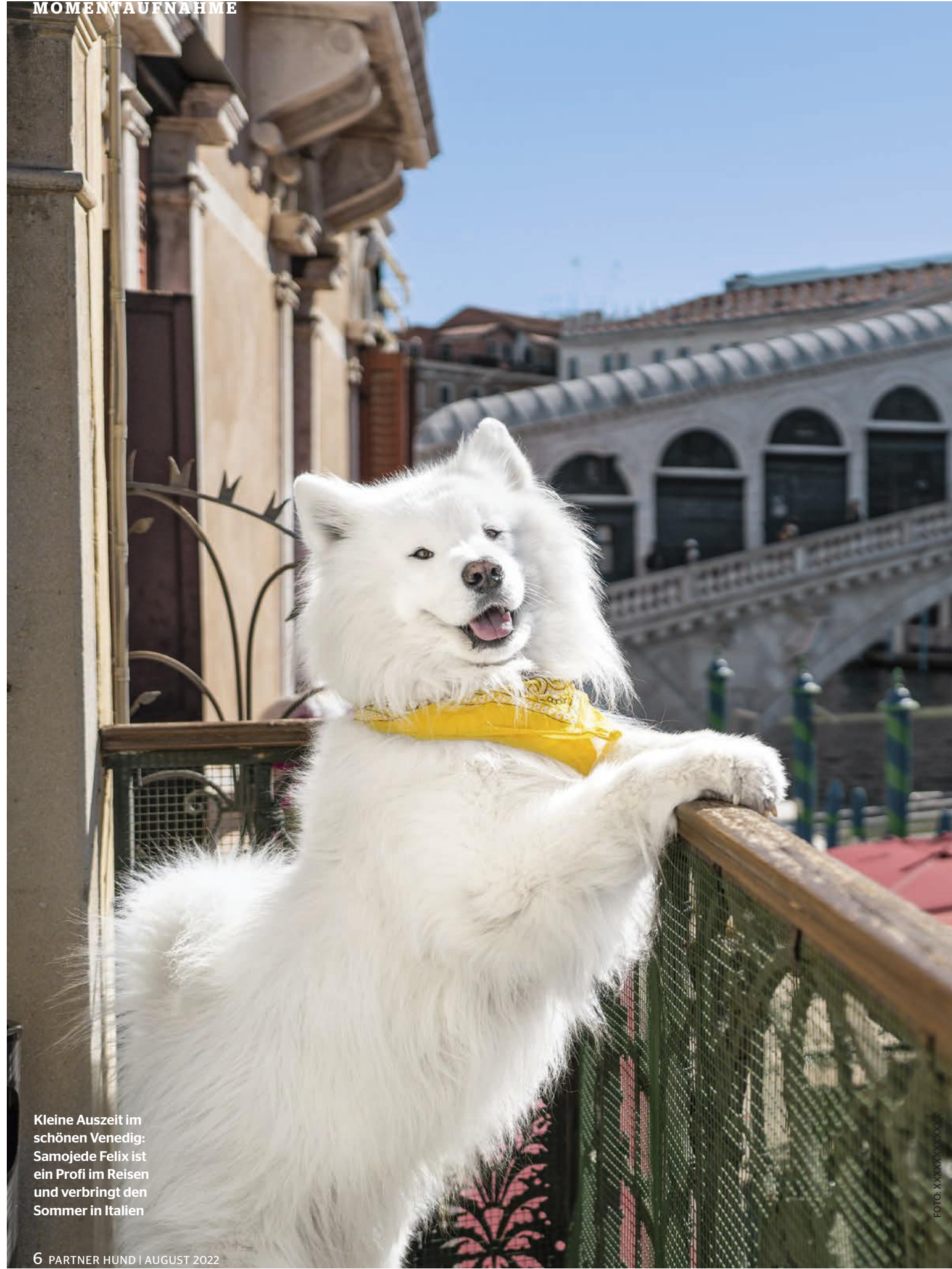
Kleine Auszeit im schönen Venedig: Samojede Felix ist ein Profi im Reisen und verbringt den Sommer in Italien