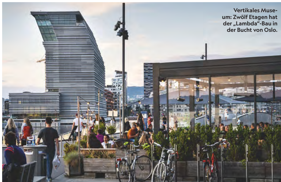
Vertikales Museum: Zwölf Etagen hat der „Lambda“-Bau in der Bucht von Oslo.

zur Geltung zu bringen. Insgesamt umfasst die Sammlung 28 000 Werke. Zusätzlich bietet der vom Architekturbüro Estudios Herreros entworfene Turm Platz für Ausstellungen zeitgenössischer norwegischer wie internationaler Künstlerinnen und Künstler. Zudem sind Konzerte, Filme und Vorträge geplant. munchmuseet.no