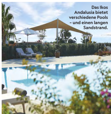
Das Ikos Andalusia bietet verschiedene Pools – und einen langen Sandstrand.