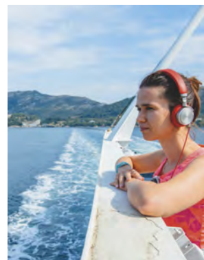
Der Hurtigruten-Podcast nimmt Hörerinnen und Hörer u. a. mit in die Antarktis.