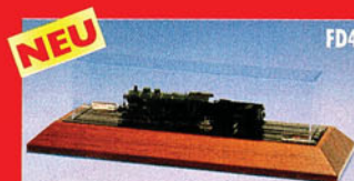
Digitales Sound-Display, für alle nicht digitalisierte Gleichstrommodelle (AC)