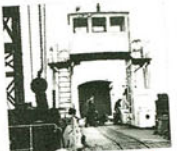
Die Geschichte der RüKB von den Anfängen bis heute