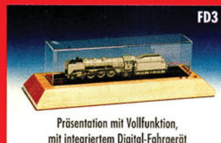
Präsentation mit Vollfunktion, mit integriertem Digital-Fahrgerät

Vertretungen: Holland – arend.jan@tiscali.net, Schweiz – train-safe@swissonline.de