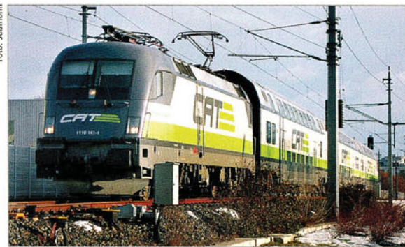
Ein CAT-Zug passiert die Haltestelle Wien St.Marx am 21. Januar 2006.