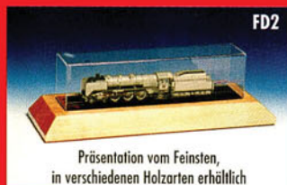
Präsentation vom Feinsten, in verschiedenen Holzarten erhältlich

Als Rollenlaufstand zur Präsentation und Wartung von Modellbahnfahrzeugen konzipiert, lassen diese vier verschiedenen Display-Typen keinen Wunsch offen.