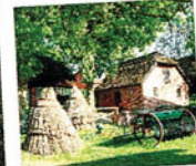
Atraktive Ausflugsziele rechts und links der Gleise