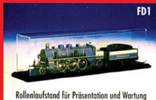
Rollenlaufstand für Präsentation und Wartung

Sylter Pendlern eine Wiedergutmachung anbieten. „Sie erhalten gegen Vorlage ihres Abonnements oder ihrer Monatskarte Gutscheine im Wert von 50 Euro. Davon können 25 Euro bei der NOB gegen Cateringprodukte oder Bahnfahrten eingetauscht werden, für den Rest können Waren und Leistungen bei Sylter Unternehmen erworben werden,“ erläutert NOB-Geschäftsführer Höppner. Das soll auch der Sylter Wirtschaft zugute kommen, nachdem sich die dortigen Geschäftsleute über den Imageschaden beklagten.