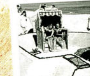
Mehr als 100 Jahre alt: Die Ostseebadkultur auf Rügen

Was wäre Deutschlands größte Ferieninsel ohne den Rasenden Roland? Auf jeden Fall um eine Hauptattraktion ärmer! Die Rügische Kleinbahn (RüKB) hat sich in ihrer 110-jährigen Geschichte zu einem Wahrzeichen der beliebten Ostsee-Insel entwickelt. Wer Rügen besucht, lässt sich die Gelegenheit nicht entgehen, auf der 750-Millimeter-Spur den Südostteil der Insel buchstäblich zu erfahren. Unser neues Spezialheft fängt Rügens Reiz samt Rasendem Roland für Sie ein: Mit Volldampf zum Ostseestrand!