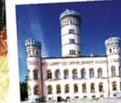
Historische Bauten zeigen Rügens reiche Geschichte