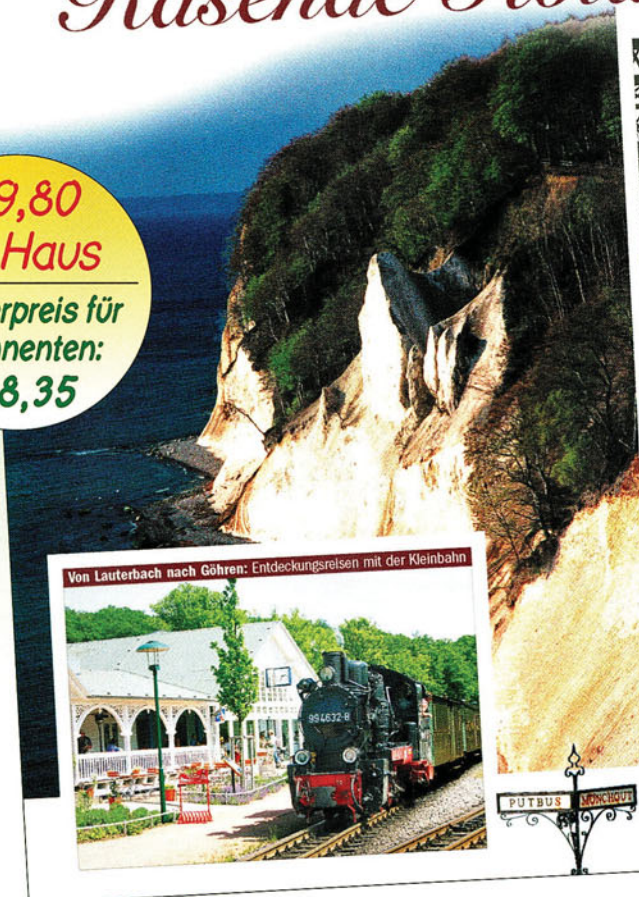
Von Lauterbach nach Göhren: Entdeckungsreisen mit der Kleinbahn

€ 9,80 frei Haus Sonderpreis für Abonnenten: € 8,35