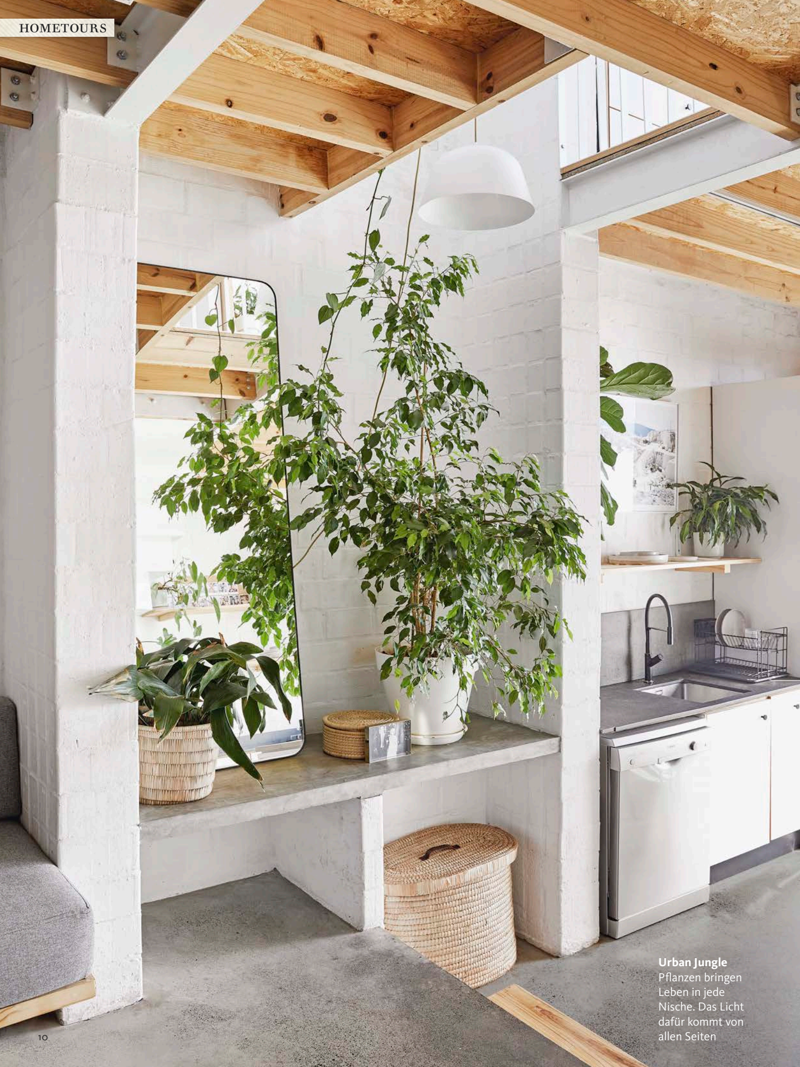
Urban Jungle Pflanzen bringen Leben in jede Nische. Das Licht dafür kommt von allen Seiten