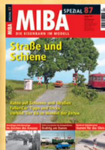
MIBA-Spezial 87/11 Straße und Schiene Best.-Nr. 120 88711