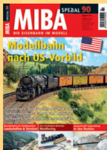
MIBA-Spezial 90/11 Modellbahn nach US-Vorbild Best.-Nr. 120 89011