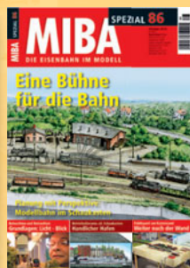
MIBA-Spezial 86/10 Eine Bühne für die Bahn Best.-Nr. 120 88610