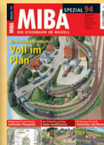
MIBA-Spezial 94/12 Modellbahn-Entwürfe: Voll im Plan Best.-Nr. 120 89412