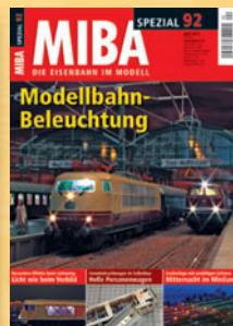
MIBA-Spezial 92/12 Modellbahn-Beleuchtung Best.-Nr. 120 89212