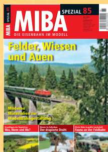
MIBA-Spezial 85/10 Felder, Wiesen und Auen Best.-Nr. 120 88510