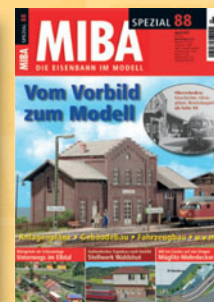
MIBA-Spezial 88/11 Vom Vorbild zum Modell Best.-Nr. 120 88811