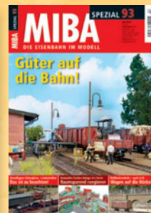
MIBA-Spezial 93/12 Güter auf die Bahn Best.-Nr. 120 89312