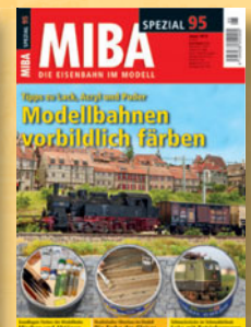
MIBA-Spezial 95/12 Modellbahnen vorbildlich färben Best.-Nr. 120 89512