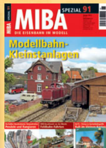
MIBA-Spezial 91/12 Modellbahn-Kleinanlagen Best.-Nr. 120 89112