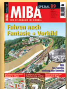
MIBA-Spezial 89/11 Fahren nach Fantasie + Vorbild Best.-Nr. 120 88911