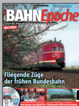
BAHN Epoche 10 Best.-Nr. 301402

Jede Ausgabe mit 100 Seiten im Großformat 22,5 x 30,0 cm, über 150 Abbildungen, Klebebindung, inkl. Film-DVD, € 12,-