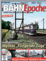
BAHN Epoche 6 Best.-Nr. 301302