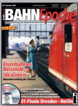
BAHN Epoche 3 Best.-Nr. 301203

BAHN Epoche verpasst? Diese Ausgaben sind noch lieferbar: