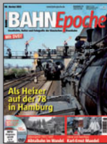
BAHN Epoche 8 Best.-Nr. 301304