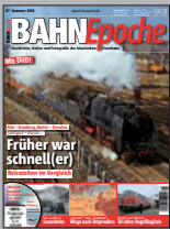
BAHN Epoche 7 Best.-Nr. 301303