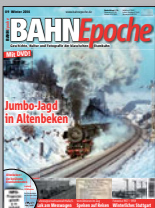
BAHN Epoche 9 Best.-Nr. 301401