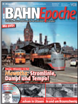
BAHN Epoche 5 Best.-Nr. 301301