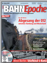
BAHN Epoche 4 Best.-Nr. 301204