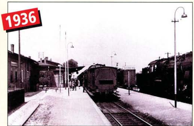
Im Sommer 1936 herrschte auf der Erfurter Bahnhofsseite reger Betrieb. Die G 12 hatte gerade ihre Rangierarbeiten beendet.

Mit dem Bau der „Pfefferminzbahn“ genannten Strecke Straußfurt – Großheringen erhielt die Stadt Sömmerda bereits 1874 einen Bahnanschluß. Mit dem Bau der Hauptbahn Erfurt – Sangerhausen 1881 und der vom Königreich Preußen geforderten niveaufreien Kreuzung der Pfefferminzbahn entstand in Sömmerda ein Turmbahnhof. Die Anlagen der Erfurter Strecke mußten bereits 1898 erweitert werden. Seine heutige Größe erhielt der Bahnhof 1936. Durch den Ausbau der in Sömmerda ansässigen Gewerfabrik, der Deyse-Werke, mußte der Bahnhof für den sprunghaft gestiegenen Pendlerverkehr erweitert werden. Dabei entstand der heute noch vorhandene Inselbahnsteig mit dem Holzdach. Nach den Demontagen der Roten Armee 1945 veränderte der Bahnhof erst 1993 sein Aussehen. Im Zuge der Elektrifizierung der Strecke Erfurt – Sangerhausen wurde die Strecke wieder zweigleisig ausgebaut.