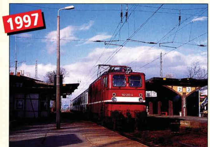
Knapp 50 Jahre später hat der Fahrdracht Sömmerda erreicht und die 142 210 wartet auf das Abfahrtsignal.

Mit dem Bau der „Pfefferminzbahn“ genannten Strecke Straußfurt – Großheringen erhielt die Stadt Sömmerda bereits 1874 einen Bahnanschluß. Mit dem Bau der Hauptbahn Erfurt – Sangerhausen 1881 und der vom Königreich Preußen geforderten niveaufreien Kreuzung der Pfefferminzbahn entstand in Sömmerda ein Turmbahnhof. Die Anlagen der Erfurter Strecke mußten bereits 1898 erweitert werden. Seine heutige Größe erhielt der Bahnhof 1936. Durch den Ausbau der in Sömmerda ansässigen Gewerfabrik, der Deyse-Werke, mußte der Bahnhof für den sprunghaft gestiegenen Pendlerverkehr erweitert werden. Dabei entstand der heute noch vorhandene Inselbahnsteig mit dem Holzdach. Nach den Demontagen der Roten Armee 1945 veränderte der Bahnhof erst 1993 sein Aussehen. Im Zuge der Elektrifizierung der Strecke Erfurt – Sangerhausen wurde die Strecke wieder zweigleisig ausgebaut.