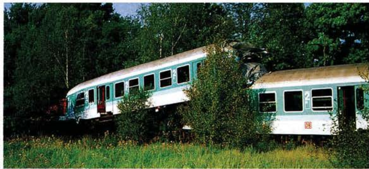
Die Wagen des Leerzuges türmten sich nach dem Zusammenstoß auf.