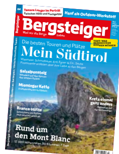
Cover: Wanderer an der Seceda

PS: Für alle Abonnenten haben wir auf dieser Seite eine praktische Plastikhülle für Ihre Bergsteiger-Tourenkarte beigelegt.