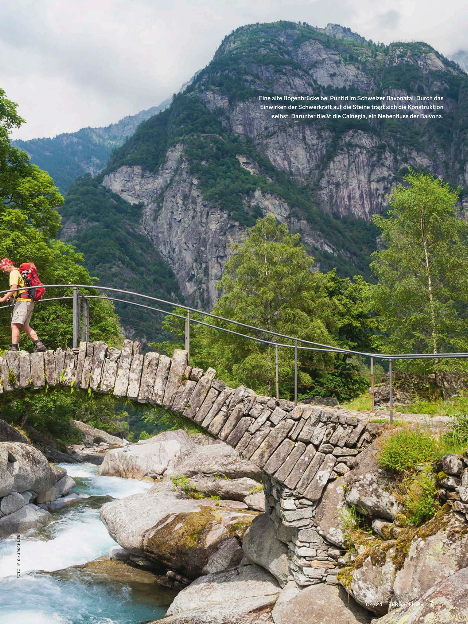
Eine alte Bogenbrücke bei Puntid im Schweizer Baviatal. Durch das Einwirken der Schwerkraft auf die Steine trägt sich die Konstruktion selbst. Darunter fließt die Calnègia, ein Nebenfluss der Balvona.