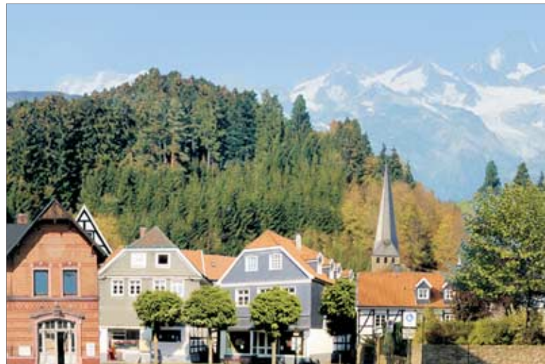
Abbildung: Horst Meier

Statt Meterware von der Stange individuelle Tapeten für den Modellbahnhintergrund mit der neuen Software von Busch.