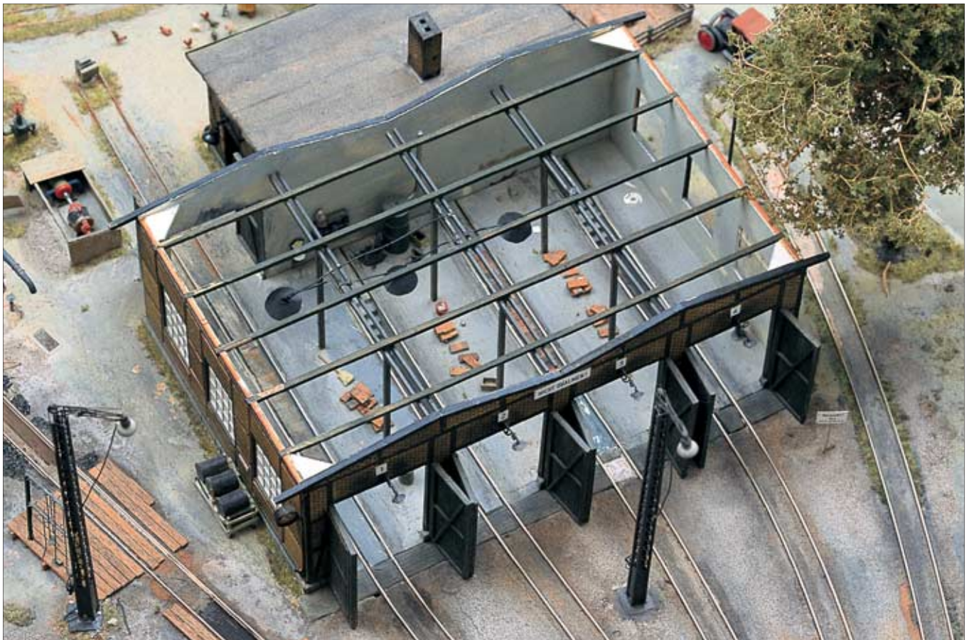
Der Lokschuppen ist ähnlich wie die Fabrik um ein inneres Gerüst herum konstruiert und kann in Einzelteilen oder auch ganz von der