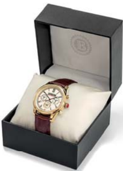
Ihre Uhr kommt in einer edlen Präsentbox zu Ihnen nach Hause