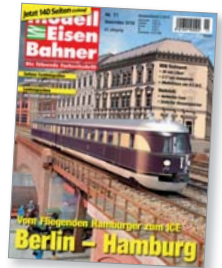
Titel: SVT in HO von Kato

Nach einer beinahe ungebremsen Aufwärtsentwicklung und dem Geschwindigkeitsrausch der 1930er-Jahre wurde der Fortschritt auf der Berlin-Hamburger Bahn jäh gestoppt. Heute reist man dagegen besser denn je.