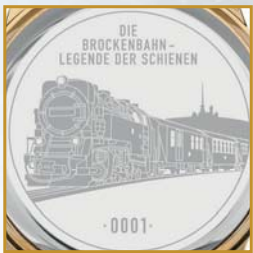
Feine Gravur: Brockenbahn-Zuggarnitur und Ausgabennummer