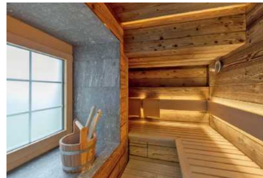
66 Selbst auf kleinstem Raum kann man eine vollständige Sauna einrichten