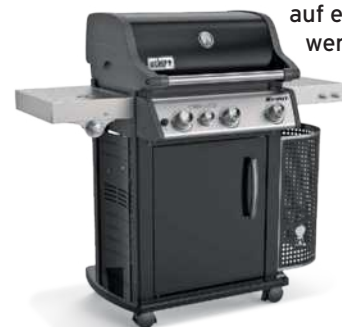
56 Die besten Grills für die kalte Jahreszeit und die Chance auf einen hochwertigen Gewinn