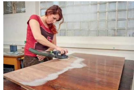
78 So holen Sie das markante Furnier des Palisanders unter der Lackschicht hervor