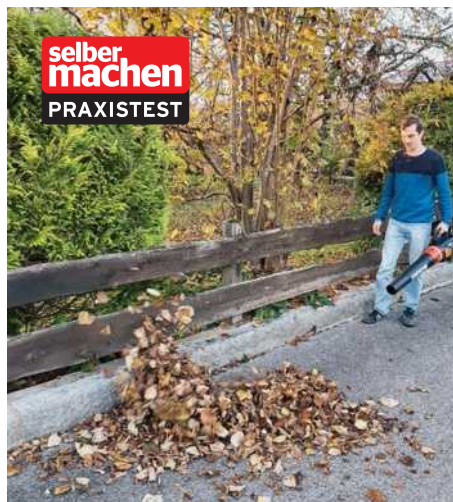
82 Wie laut ist der Akku-Laubbläser? Wie viel Leistung bringt er? Die Antworten im Test