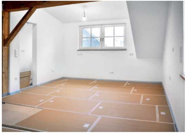
24 Auf den Schallschutzplatten kann man einfach eine Flächenheizung nachrüsten