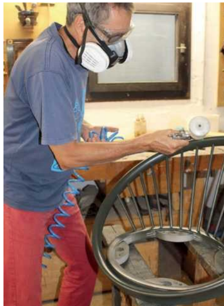
60 Mit Kompressor und Spritzpistole wird der Korpus des Stuhls neu lackiert

Alles, was Sie zur Planung der hauseigenen Sauna wissen sollten