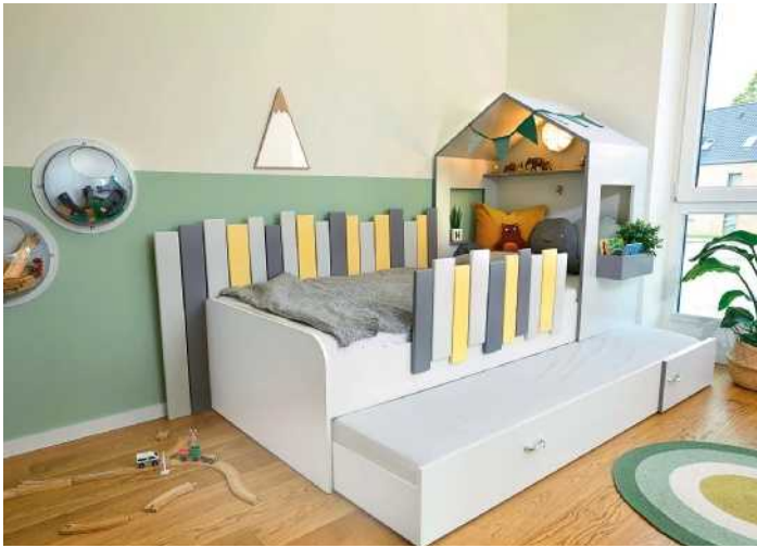
28 Mit Häuschenaufbau und Zaun wird das Kinderbett zur gemütlichen Kuselhöhle