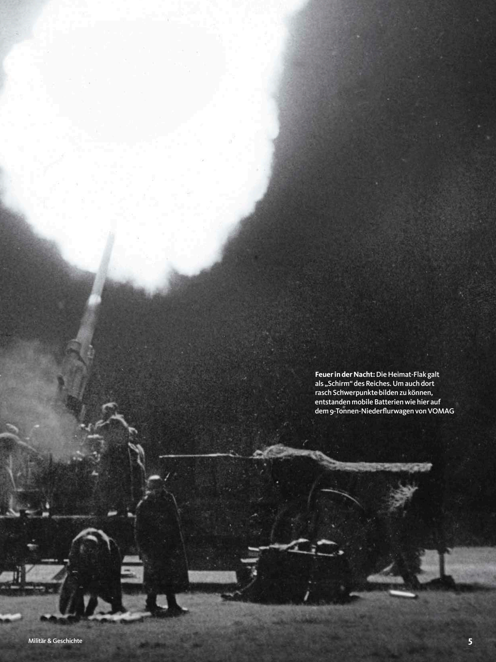
Feuer in der Nacht: Die Heimat-Flak galt als „Schirm“ des Reiches. Um auch dort rasch Schwerpunkte bilden zu können, entstanden mobile Batterien wie hier auf dem 9-Tonnen-Niederflurwagen von VOMAG