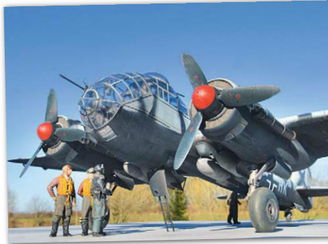
Sichtlich Freude hatte unser Autor mit seinem Modell der Ju 188, auch beim Fotografieren

Ein sehr prominentes Beispiel für so eine Gemengelage können wir Ihnen ab Seite 20