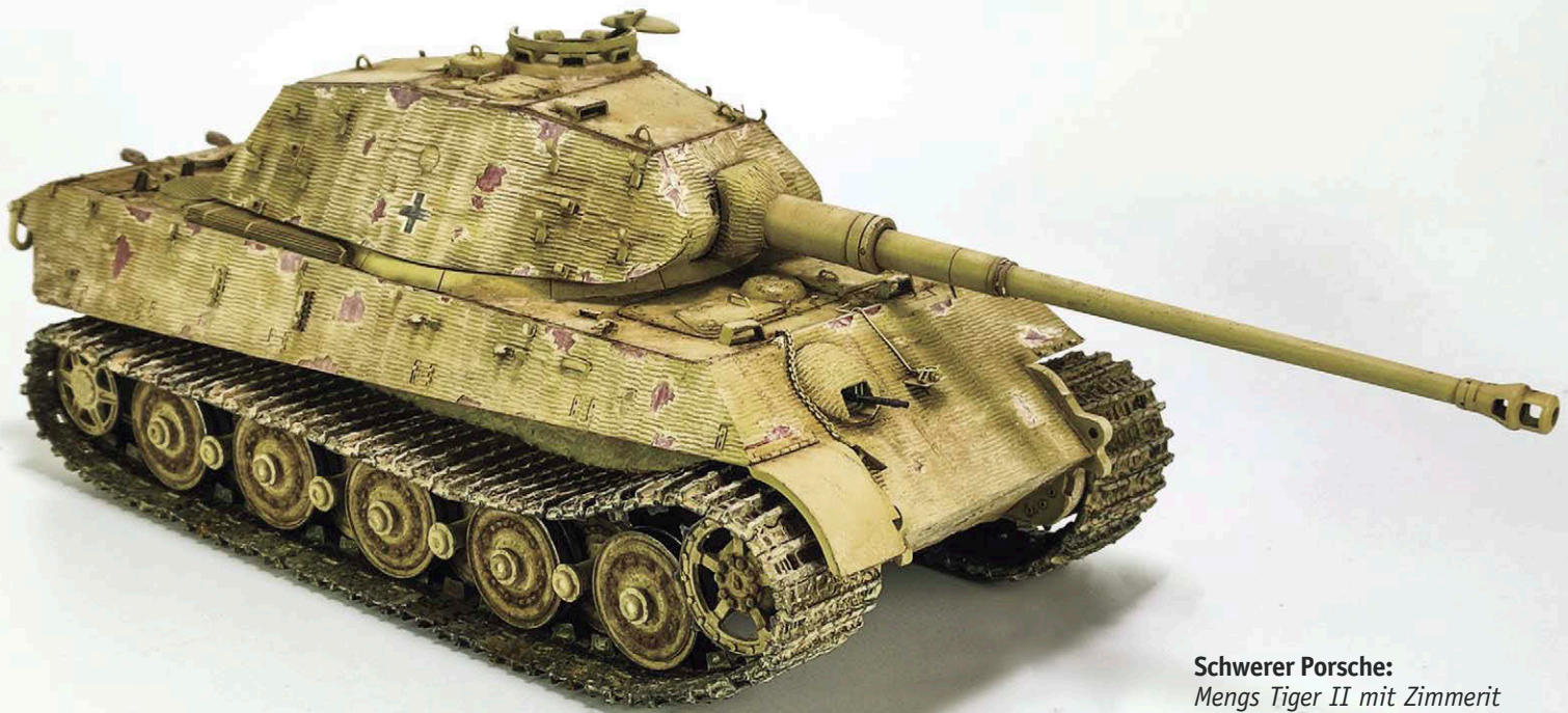
Schwerer Porsche: Mengs Tiger II mit Zimmerit