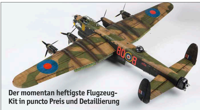
Der momentan heftigste Flugzeug-Kit in puncto Preis und Detaillierung