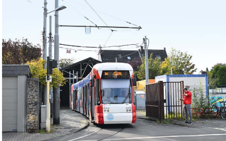
Krefeld: Am Endpunkt im Gelände des früheren Betriebshofes Hüls wendet Tw 668 am 17. Oktober, am Folgetag begann der Abbruch der alten Wagenhalle im Hintergrund

■ Frankfurt am Main: Am 17. Oktober führte der Verein Historische Straßenbahn der Stadt Frankfurt am Main e. V. in Zusammenarbeit mit der VGF Foto-/Bewegungsfahrten mit dem U3-Museumszug zur Freude der Fotografen durch. Dabei befuhren die Wagen 151, 152 und 153 in wechselnder Zugbildung sowohl als Solowagen als auch als Doppel- und Dreifachtraktion verschiedene Strecken des Netzes. Hier ist der komplette Zug zwischen Kalbach und Riedwiese/Mertonviertel unterwegs