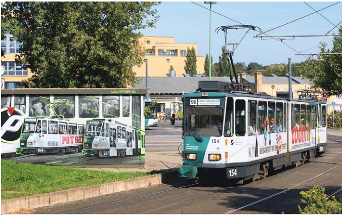
Was hinter den bunten Tram-Malereien steckt 16