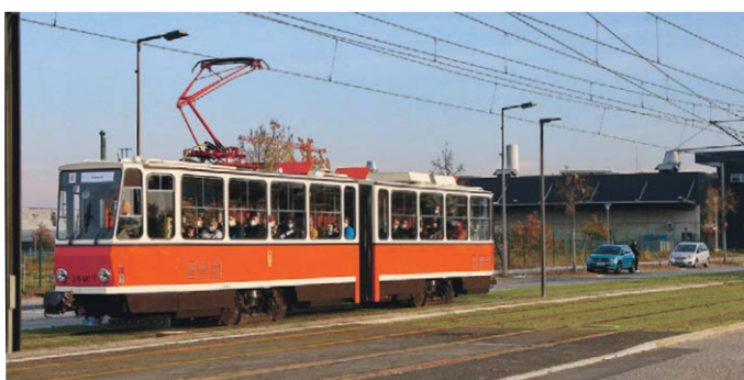
KT4D Nr. 219 481-3 (oben) und 219 282-8 an der Kehranlage Landschaftspark Johannisthal im Zuge der Neubaustrecke „Adlershof II“. Die Sonderfahrten waren lange im Voraus ausgebucht