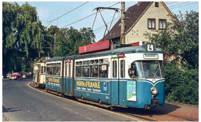
Kassel: Die alte Strecke zum VW-Werk in Baunatal 74