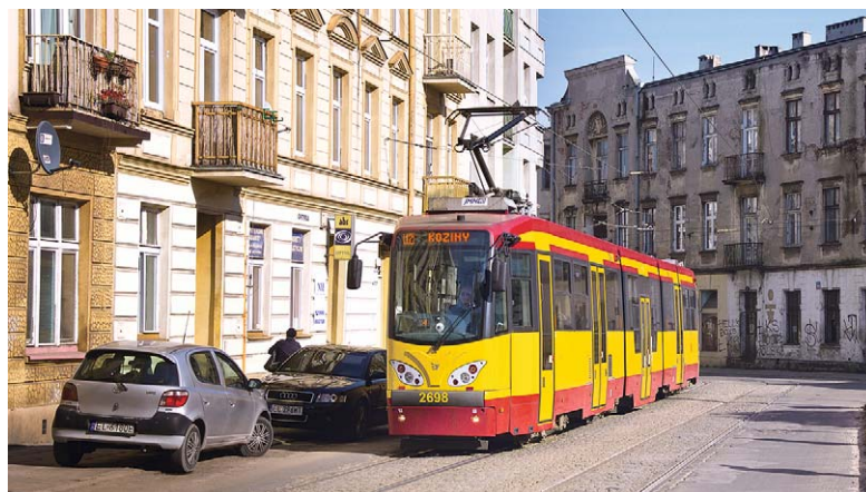
Bielefeld: Mit einem stark veränderten „Gesicht“ fahren die 2013 übernommenen Bielefelder M8C heute als M8Cn in Łódź, auch die jüngst übernommenen Tw sollen dieses Erscheinungsbild erhalten

len die Kapazitäten vor allem auf den Linien 4, 13 und 18 vergrößert werden.