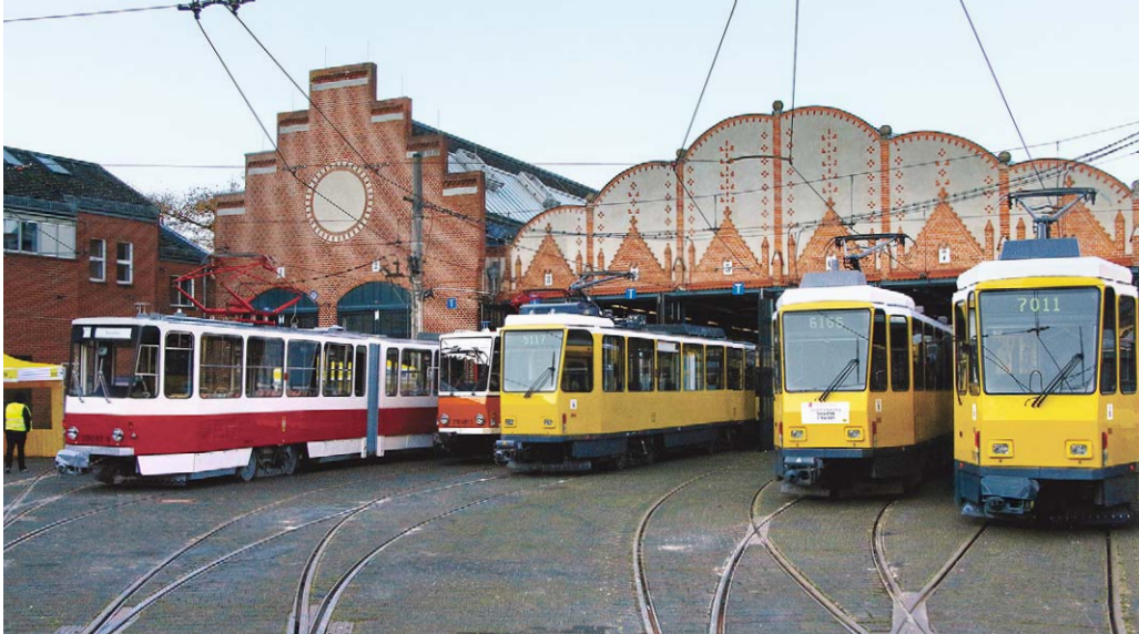
Tatra-Parade im Betriebshof Köpenick. Die BVG veranstaltete hier am 30. Oktober einen Tag der offenen Tür und holte dabei die Verabschiedung der KT4D nach, deren Linieneinsatz bereits am 7. Mai endete