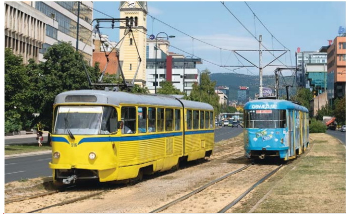
Sarajevo: So wird der Betrieb grundlegend saniert 26