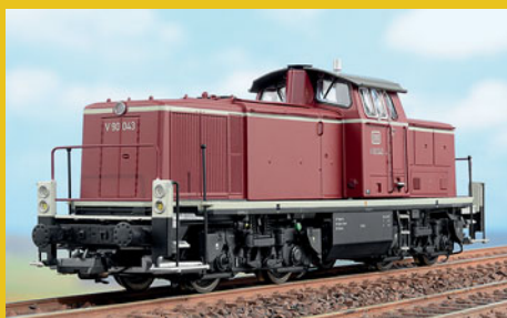
V 90 von ESU im MIBA-Test