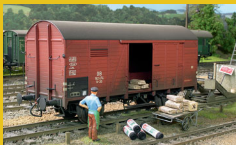
Güterwagen vorbildlich patiniert