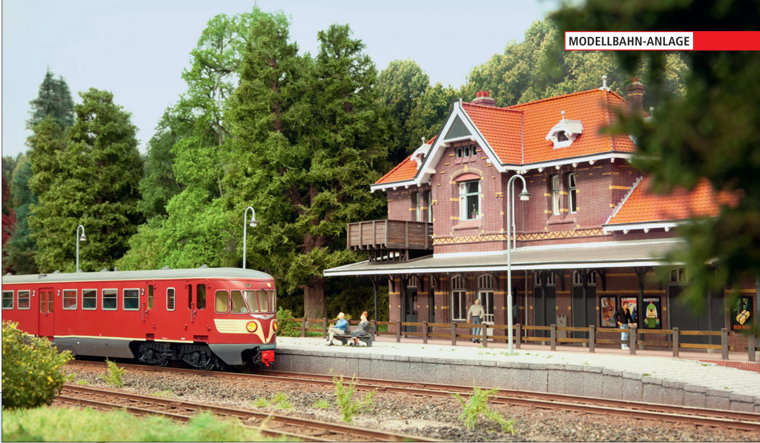
Ein DE-2 Triebwagen fährt vom Endbahnhof Baarn kommend in Soest ein. Hier findet eine Kreuzung mit dem entgegenkommenden Zug statt. Von Soest aus fährt der DE-2 in den Schattenbahnhof ein.

Blick über den mittleren Anlagenteil mit den Gleisanlagen des Abzweigs „Sandgrube“, deren Ladegleis (dort wo der Niederbordwagen steht) nur angedeutet ist.