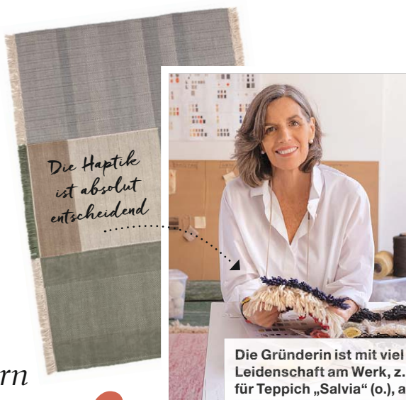
Die Gründerin ist mit viel Leidenschaft am Werk, z. B. für Teppich „Salvia“ (o.), ab ca. 790 Euro (Nanimarquina)

Sessel „Kata“, je ab ca. 1.300 Euro (Arper)