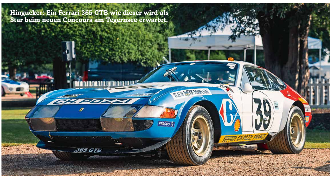
Hingucker: Ein Ferrari 365 GTB wie dieser wird als Star beim neuen Concours am Tegernsee erwartet.

Schauplatz ist Gut Kaltenbrunn am Tegernsee, etwa 40 Autominuten von München entfernt. Erwartet werden insgesamt 200 historische Automobile, darunter auch ein 1971er Ferrari 365 GTB4 und ein 1967er AC 428 mit dem legendären Ford-V8 und italienischem Styling von Pietro Frua. Den Auftakt des Concours of