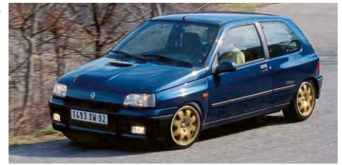
Schnell und selten: Der Renault Clio Williams von 1994 ist ein gesuchtes Sammlerobjekt.

Mit dem Erreichen des H-Kennzeichens Alters durch Pkw der 1990er Jahre, die im Vergleich zu früheren Jahrzehnten einen verbesserten Rostschutz und eine höhere Gebrauchssicherheit aufweisen, entstanden Bedenken, dass diese als Alltagsfahrzeuge genutzt werden könnten. Dies würde die ursprüngliche Intention des H-Kennzeichens, nämlich die Pflege des automobilen Kulturgutes bei gleichzeitiger Befreiung von bestimmten Steuern und Fahrverboten, untergraben. In seiner „Bestandsanalyse 90er-Jahre-Pkw“ prognostiziert der DEUVET Bundesverband Oldtimer-Youngtimer e.V., basierend auf bisherigen Bestandsänderungen, dass der Marktmechanismus, der bereits bei Fahrzeugen der 70er- und 80er-Jahre beobachtet wurde, auch hier wirksam sein wird. Nur wenige Fahrzeuge