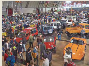
Eng an eng präsentieren sich automobile Raritäten.

der 80er und 90er Jahre“ zeigt, wie damals Fahrzeuge zu wahren Paradiesvögeln mutierten. Breite Karosserien im „Testarossa-Look“, thekenartige Heckspoiler à la F40, Flügeltüren, Felgen wie Waschtrommeln, grelle Effektlackierungen, metallisiertes Leder sowie jede Menge HiFi bis hin zum Fernseher im Innenraum machten vor keinem Modell halt. Ob von VW, Opel, Mercedes-Benz, BMW, Porsche oder Ferrari, ob Brot-und-Butter-Auto oder Luxuskarosse, alle waren nach einer „Individualisierungskur“ nicht wiederzuerkennen und machen die Retro Classics noch vielfältiger und bunter.