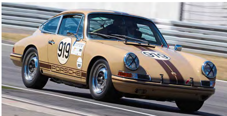
Oldtimer-Rennwagen wie dieser Porsche 911 aus dem Jahr 1965 (Beispielbild) dienten den Aachener Fälschern als Vorlage für ihre Betrügereien.