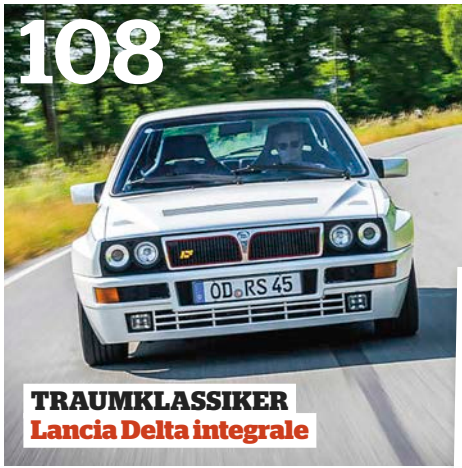
TRAUMKLASSIKER Lancia Delta integrale