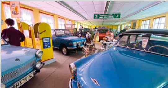
Der Fundus des DDR-Museums wurde versteigert

Aus für das beliebte Dresdner DDR-Museum „Die Welt der DDR“ im Simmel-Hochhaus. Seit 1. Juni ist die Ausstellung geschlossen, da die Anforderungen zum Weiterbetrieb potenzielle Interessenten abgeschreckt haben. Die rund 75.000 Exponate der Ausstellung wurden vom Dresdner Auktionshaus Günther katalogisiert und am 8. Juli im Museum versteigert.