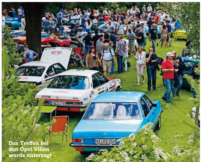
Das Treffen bei den Opel Villen wurde untersagt