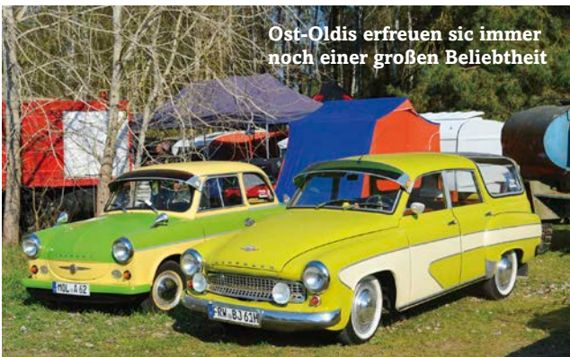
Ost-Oldis erfreuen sich immer noch einer großen Beliebtheit