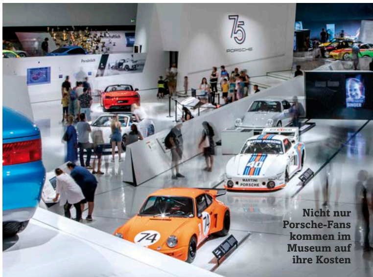
Nicht nur Porsche-Fans kommen im Museum auf ihre Kosten