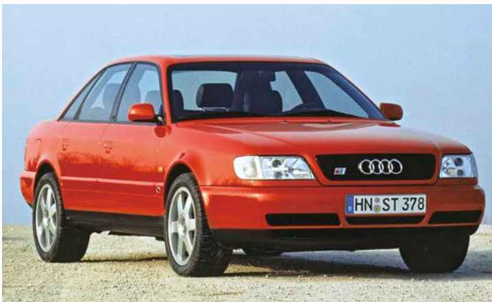
Die S6 plus Limousine gehört zu den Raritäten der quattro GmbH

ren Teil des Fahrzeugs werden die Insassen beidseitig eingeklemmt, weshalb ihre Überlebenschancen sehr gering ausfällt. Wenn es schon eine Fahrt mit einem Kultcamper sein soll, raten die Experten zu besonders umsichtiger Fahrweise, einer Beachtung der Beladungsgrenze und der Ladungssicherung, sowie einer Aktualisierung der Sicherheitsausstattung. Defekte Gurtsysteme oder Rost an tragenden Teilen sind beim Oldcamper keinesfalls Bestandteil des Kults, sondern lebensgefährlich.