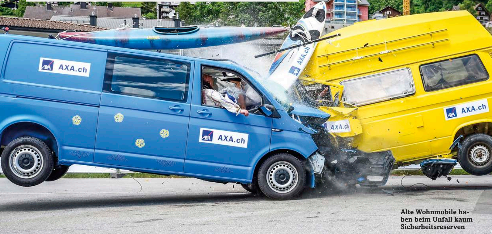
Alte Wohnmobile haben beim Unfall kaum Sicherheitsreserven