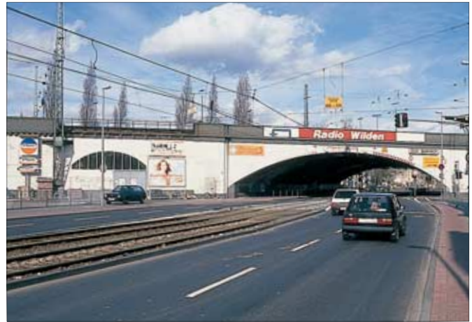
Am Bahnhof Köln-Ehrenfeld unterquert der Ehrenfeldgürtel die Bahnlinie Köln–Aachen; der Bahnhof, heute S-Bahn-Station, ist sehr einfach gehalten. Oben rechts: Zur Überquerung breiter Straßen sind auch entsprechend weit geschwungene Brückenbögen erforderlich. Unten: Die verkürzt zusammengesetzte und bemalte Auhagen-Brücke nebst Brückenköpfen